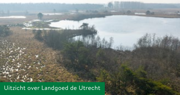
Uitzicht over Landgoed de Utrecht