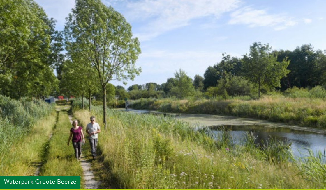
Waterpark Grote Beerze