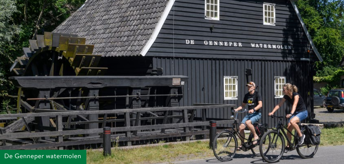
De Genneper watermolen