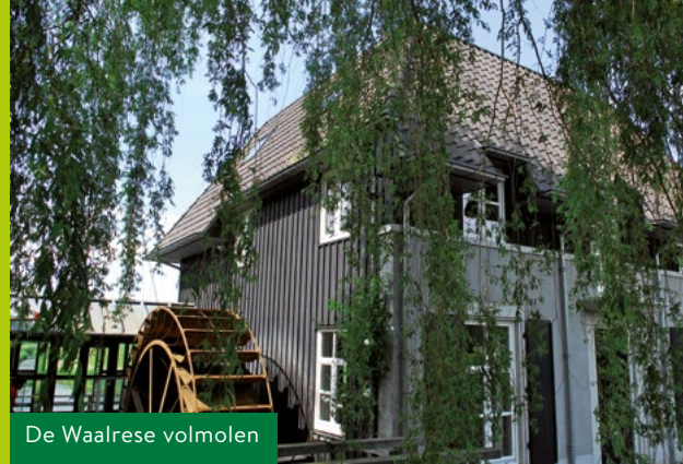
De Waalrese volmolen

Kp 61 – kp 44 | Op kruising bij kp 61 RD en direct RA kp 45 volgen. Bij de eerste zijweg (dubbelbaans fietspad) RA . Bij kp 45 RD weg oversteken en Gildebosweg in ri kp 91 . Na 250 meter op splitsing RA ri kp 91 . Bij kp 91 LA , Loonderweg ri kp 44 . Over Loonderweg RD . Na bocht naar R heet weg Timmereind. Op splitsing RA ri kp 44 . Aan het eind weg oversteken en op fietspad bij kp 44 LA ri kp 25 .