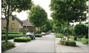
huidige situatie / streefbeeld Vliaskuilseweg