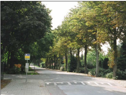
huidige situatie / streefbeeld Annendaalderweg