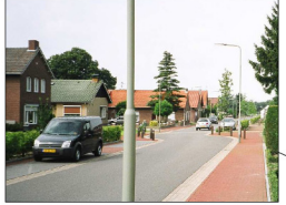
huidige situatie / streefbeeld Diergaarderstraat West