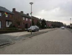
huidige situatie Kerkweg