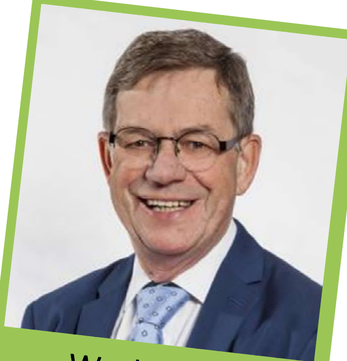
Wethouder Hub Meuwissen