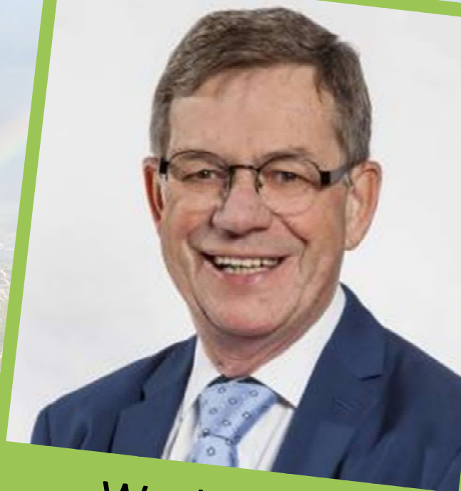
Wethouder Hub Meuwissen