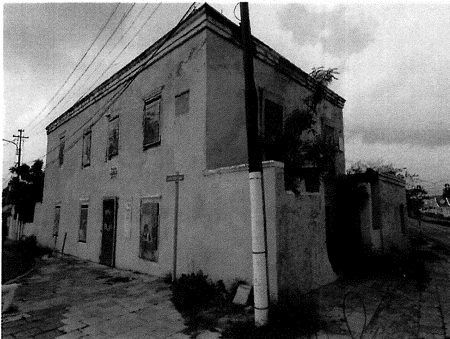
Foto 12 Zicht op het registergoed