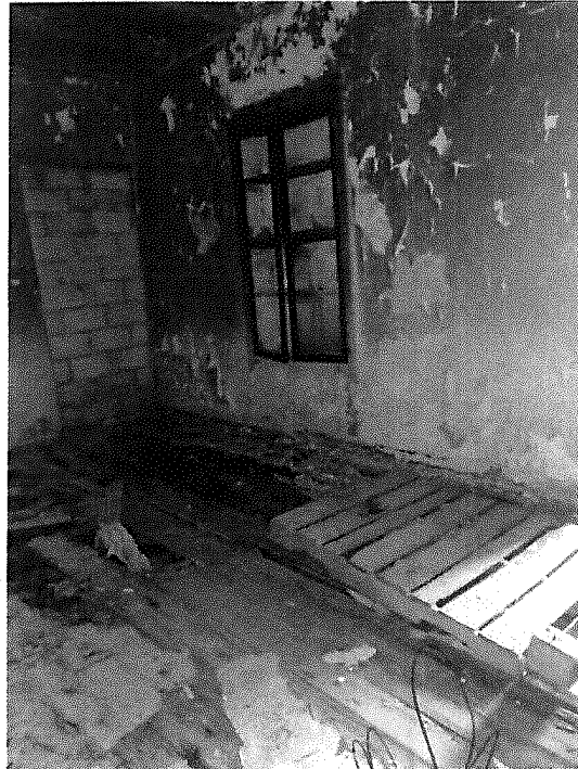
Foto 10 Vloer detail