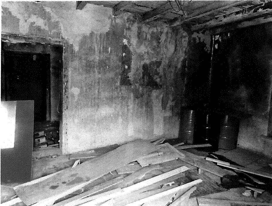
Foto 11 Vloer detail