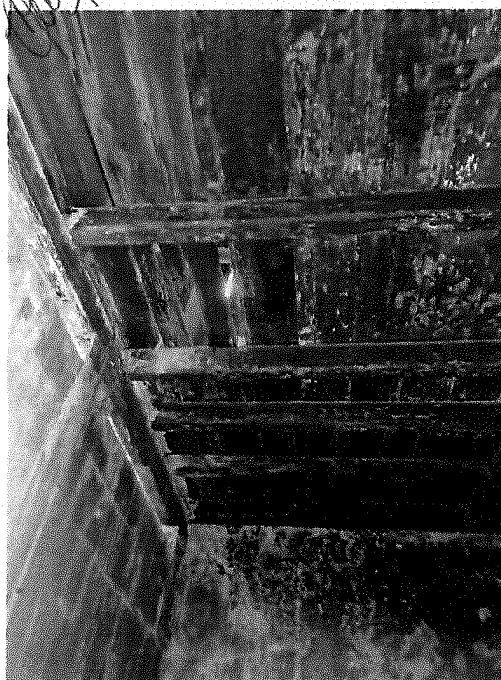
Foto 9 Plafond en verdieping vloer detail

Taxatiekantoor Joubert Emancipatie Blvd. 25, Curaçao Tel. (599)-9-737 0505 • Fax (599)-9-737 6438 • E-mail info@joubertrealty.com • Internet www.joubertrealty.com Crib nummer 102137663 • Kamer van Koophandel Curaçao nummer 98642