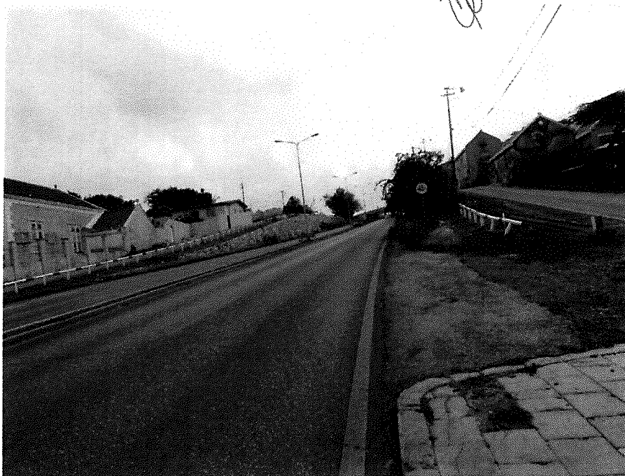
Foto 13 Straatbeeld

Taxatiekantoor Joubert Emancipatie Blvd. 25, Curaçao Tel. (599)-9-737 0505 • Fax (599)-9-737 6438 • E-mail info@joubertrealty.com • Internet www.joubertrealty.com Crib nummer 102137663 • Kamer van Koophandel Curaçao nummer 98642