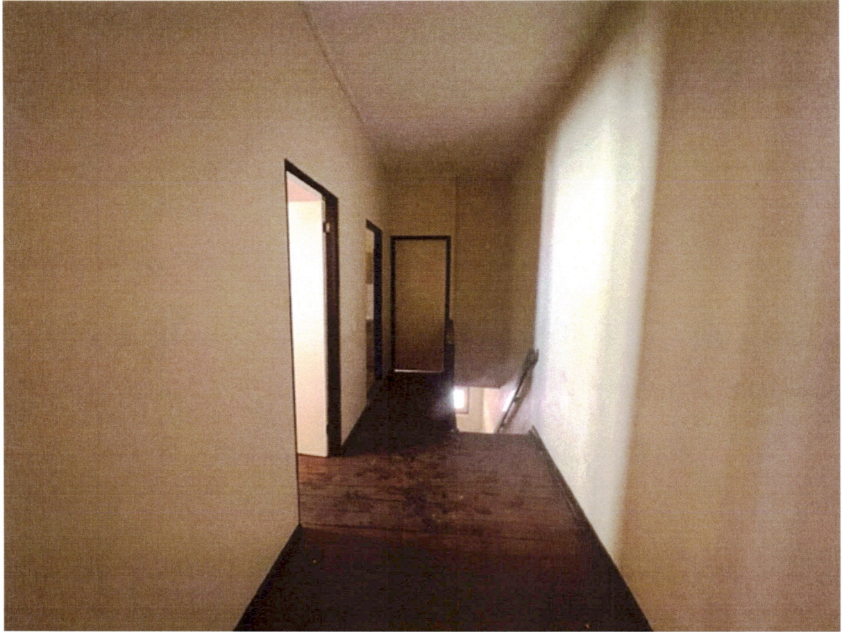
Hal en slaapkamer