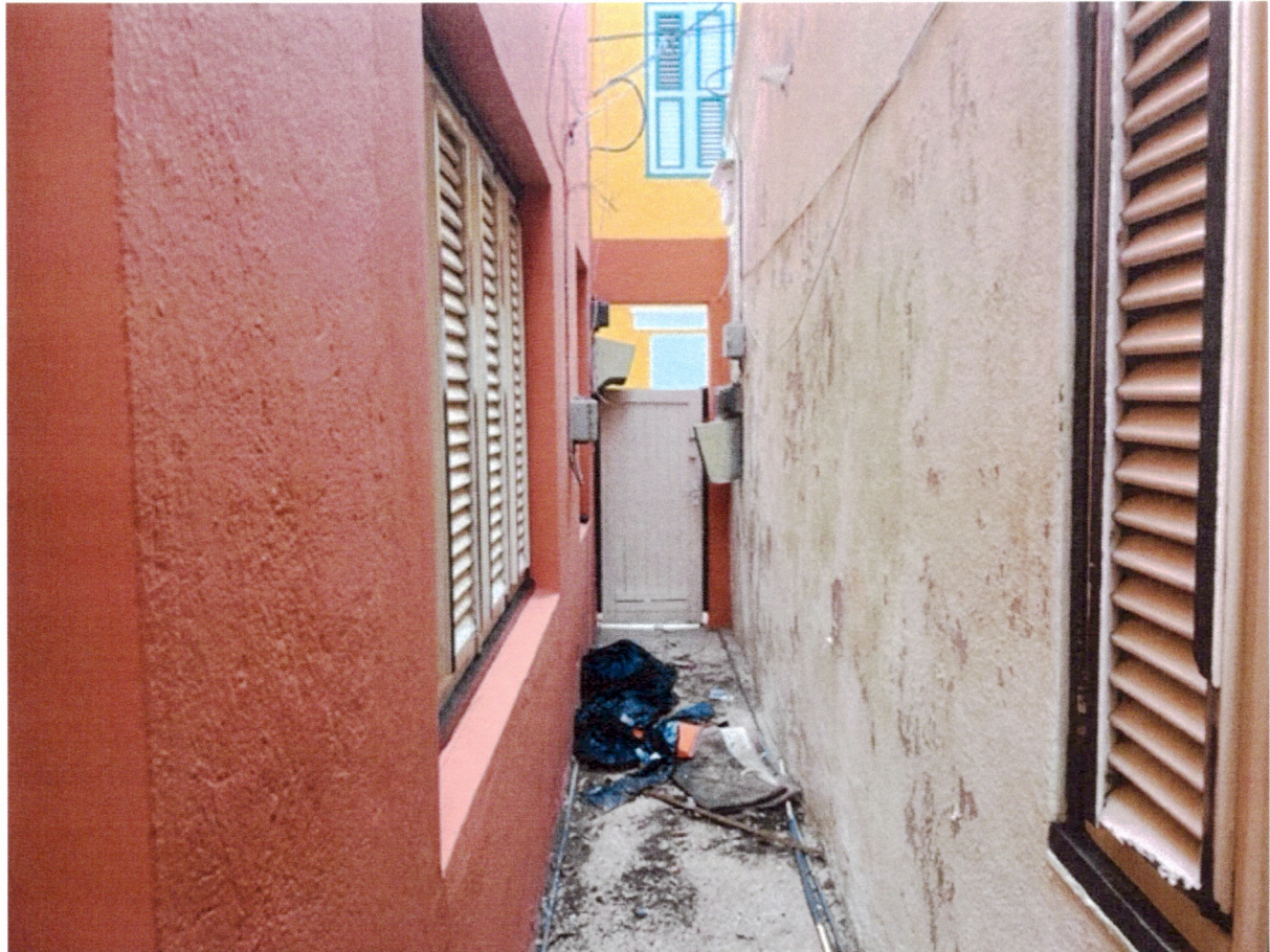
Zijingang en achterterras