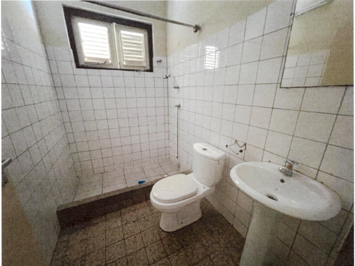
Badkamer en slaapkamer