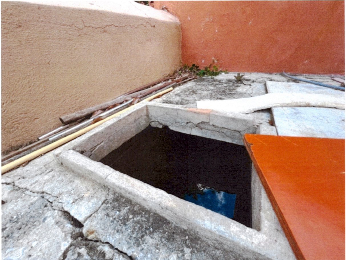
Waterbak en achtergevel