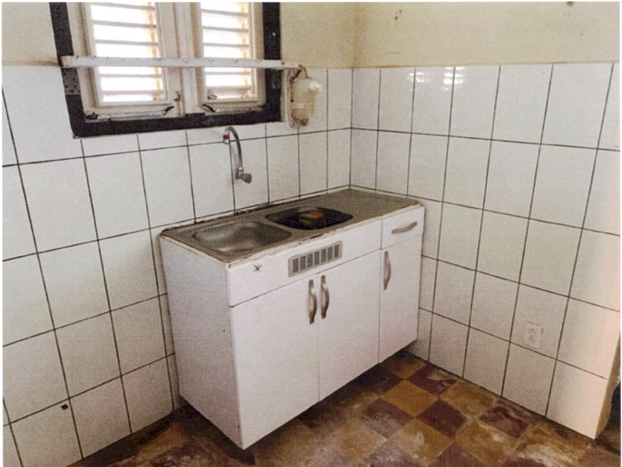
Keuken en slaapkamer