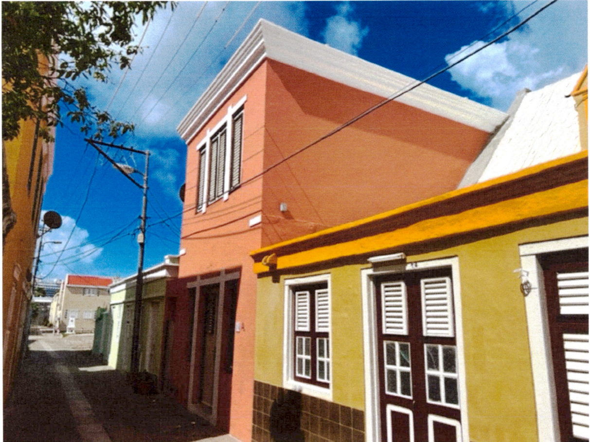
Aanzicht zijgevel en woonkamer