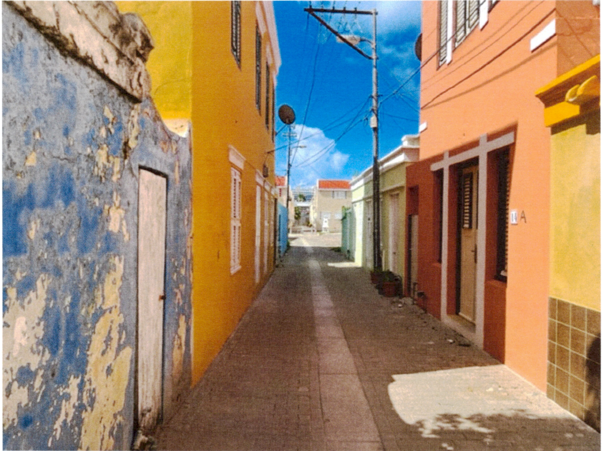
Straatbeeld en pagatino