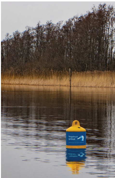
De vogelrustgebieden zijn gemarkeerd met gele boeien met daarop een blauwe sticker met een slobbeend.