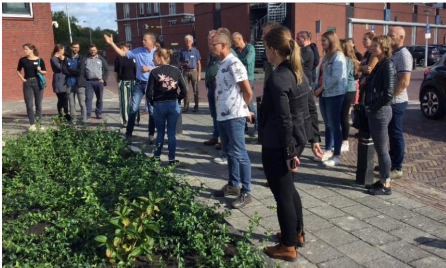
KENNISUITWISSELING OVER BIODIVERSITEIT IN DE PRAKTIJK TUSSEN FRIESE GEMEENTEN