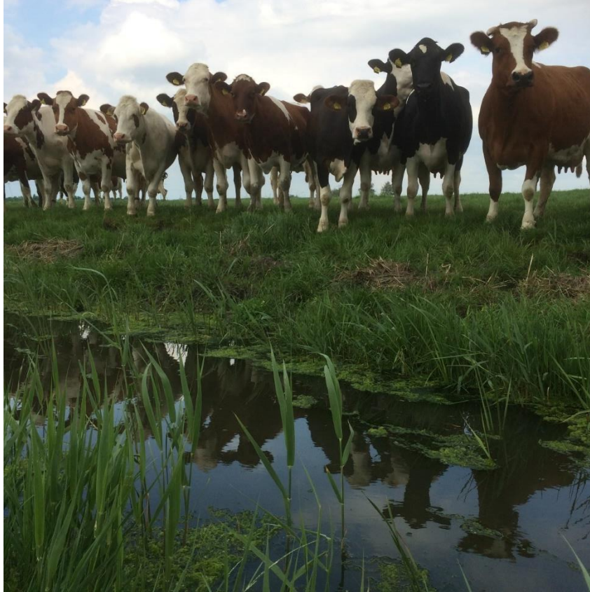
Boerensloot tussen Makkum en Wons

ONTWERP september 2021 PROVINCIE FRYSLAN