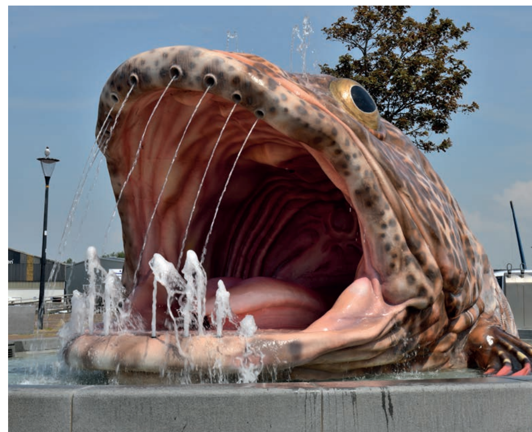
De Vis (2018), Mark Dion – Stavoren