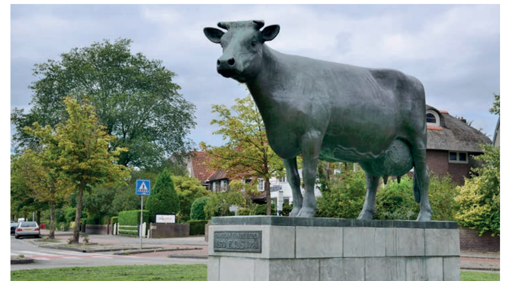
Ús Mem (1954), Gerhardus Jan Adema - Leeuwarden

Wij zien dat er heel veel verschillende uitingen van kunst zijn. Dat varieert van kunst om gebeurtenissen of personen te herinneren (ook wel memoriekunst) of kunst ter verbijzondering van een plek. Sommige kunstwerken hebben ook een behoorlijke bekendheid gekregen zoals het beeld De Stienen Man op de dijk bij Harlingen of Ús Mem in Leeuwarden.