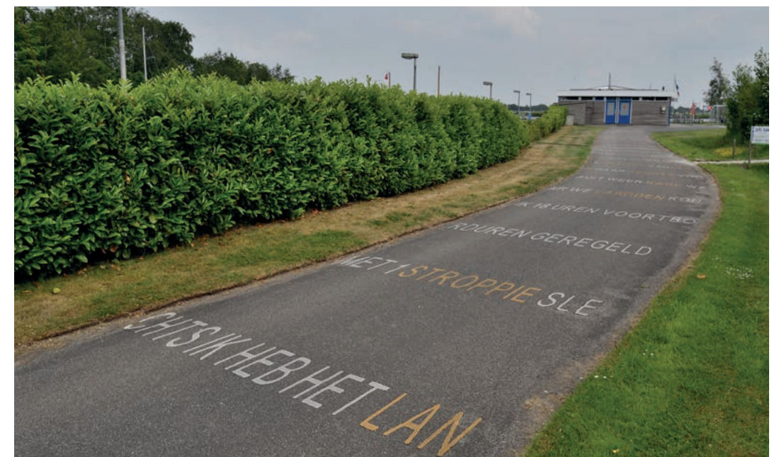
'Gegron'd door Benne van der Velde, Erwin Christiaan Adema – nabij Suwâld

Grote kunstprojecten laten zien dat er echt bijzondere zaken met een bovenlokale uitstraling tot stand kunnen komen. Dat maakt investeren in kunst extra interessant.