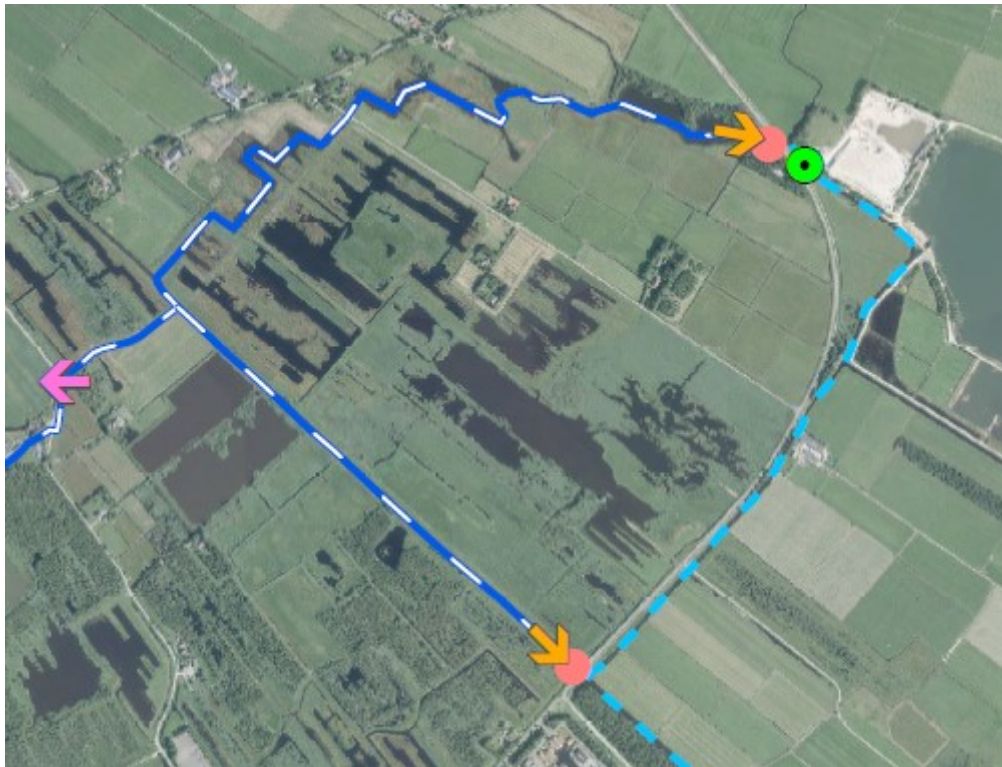
De oranje pijlen geven de 'overhaallocaties' aan