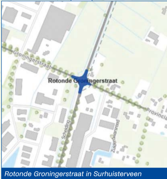
Rotonde Groningerstraat in Surhuisterven