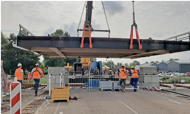
Uithijzen van het brugdek