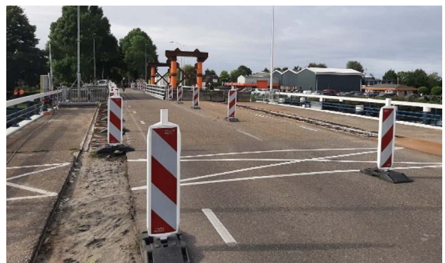
Huidige verkeerssituatie met noodbrug

Vanaf donderdag 17 november plaatsen we de verstevigde hameitoren, de balansen en het brugdek terug. Daarna voeren we de beton- en asfaltwerkzaamheden uit. Ook brengen we de nieuwe slagboomkasten aan en stellen we deze af. Op maandag 19 december vanaf 05:00 zijn de brug en het wegdek gereed.