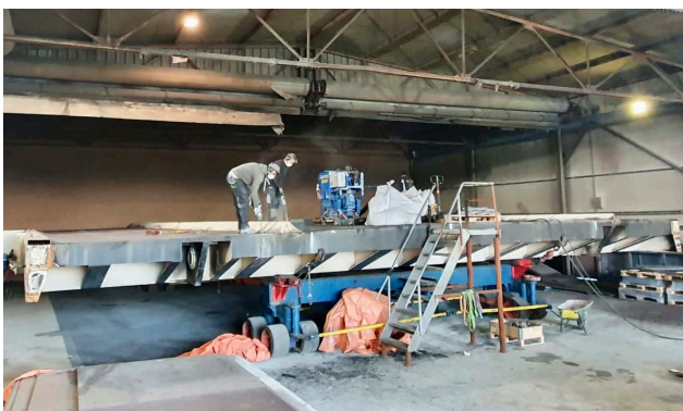
Werkzaamheden bij Solidd in de fabriek

Er ligt nu een noodbrug in het wegdek ter plaatse van de Sânsleatbrêge. Het verkeer wordt geregeld met verkeerslichten. Wacht tot u groen licht heeft en denk om elkaars veiligheid.