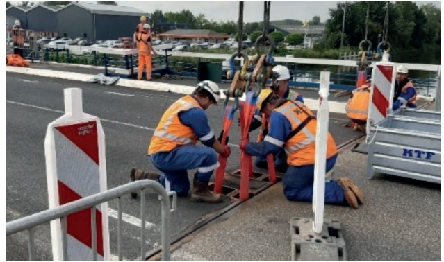
Medewerkers hangen het brugdek in de kraan