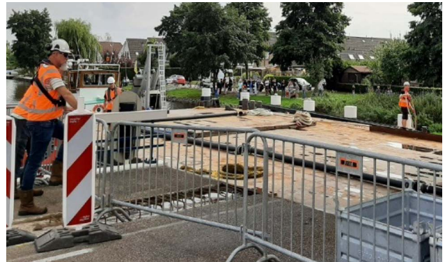
Ponton voor transport brugdek