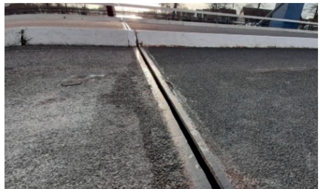
Rij-ijzer en witte betonbanden

In het weekend van 9 tot en met 11 september hebben we de stalen onderdelen van de oude brug verwijderd. Deze zijn per schip getransporteerd naar de fabriek van aannemer Solidd in Sumar. De foto's geven een impressie van de uitgevoerde werkzaamheden.