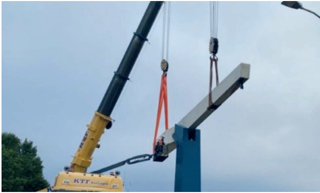
Uithijzen van één van de balansen