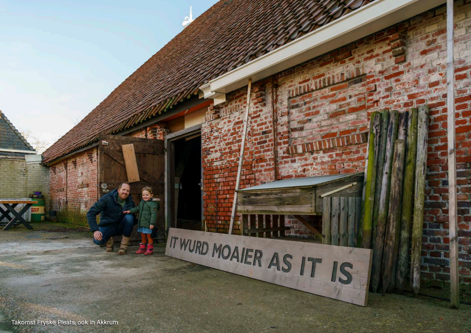
Takomst Fryske Pleats, ook in Akkrum