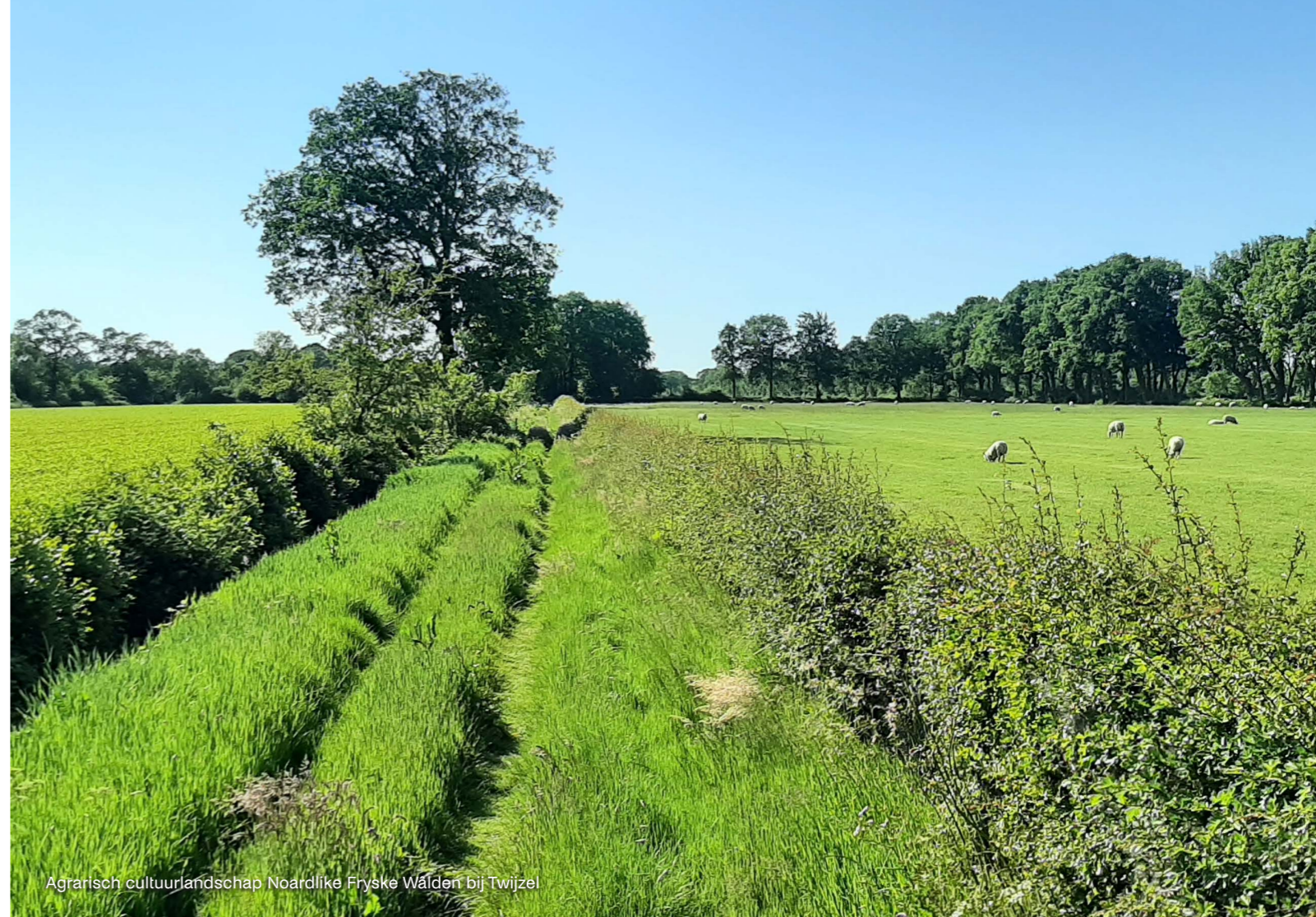
Agrarisch cultuurlandschap Noardlike Fryske Wâldert bij Twijzel

De procedure van een omgevingsprogramma staat in de Omgevingswet en bevat onder andere participatie en tervisielegging van het ontwerp. De betrokkenheid van PS is nader uitgewerkt in de brief van GS van 11 juli 2023 over de werkwijze 'vaststellen omgevingsprogramma's'. Omdat dit programma Nij Poadium opvolgt en beleidscomponenten bevat wordt PS expliciet gevraagd om wensen en bedenkingen aan te geven. Dit resulteert in de volgende na te streven planning in 2024.