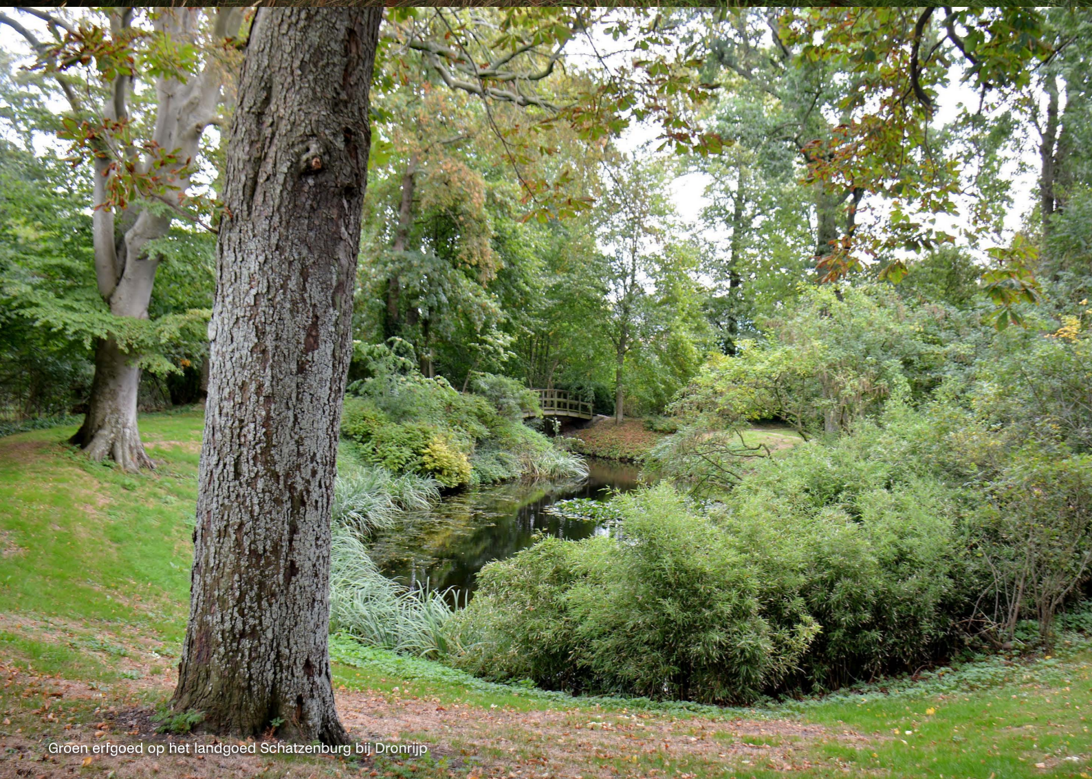
Groen erfgoed op het landgoed Schatzenburg bij Dronrijp

koppeling te maken met openstellingen voor subsidiëring van zogenaamde niet-productieve investeringen in het kader van het Gemeenschappelijk Landbouw Beleid (GLB) waarbij onder andere elzensingels, lanen, erfbeplanting en greppelland kunnen worden hersteld.