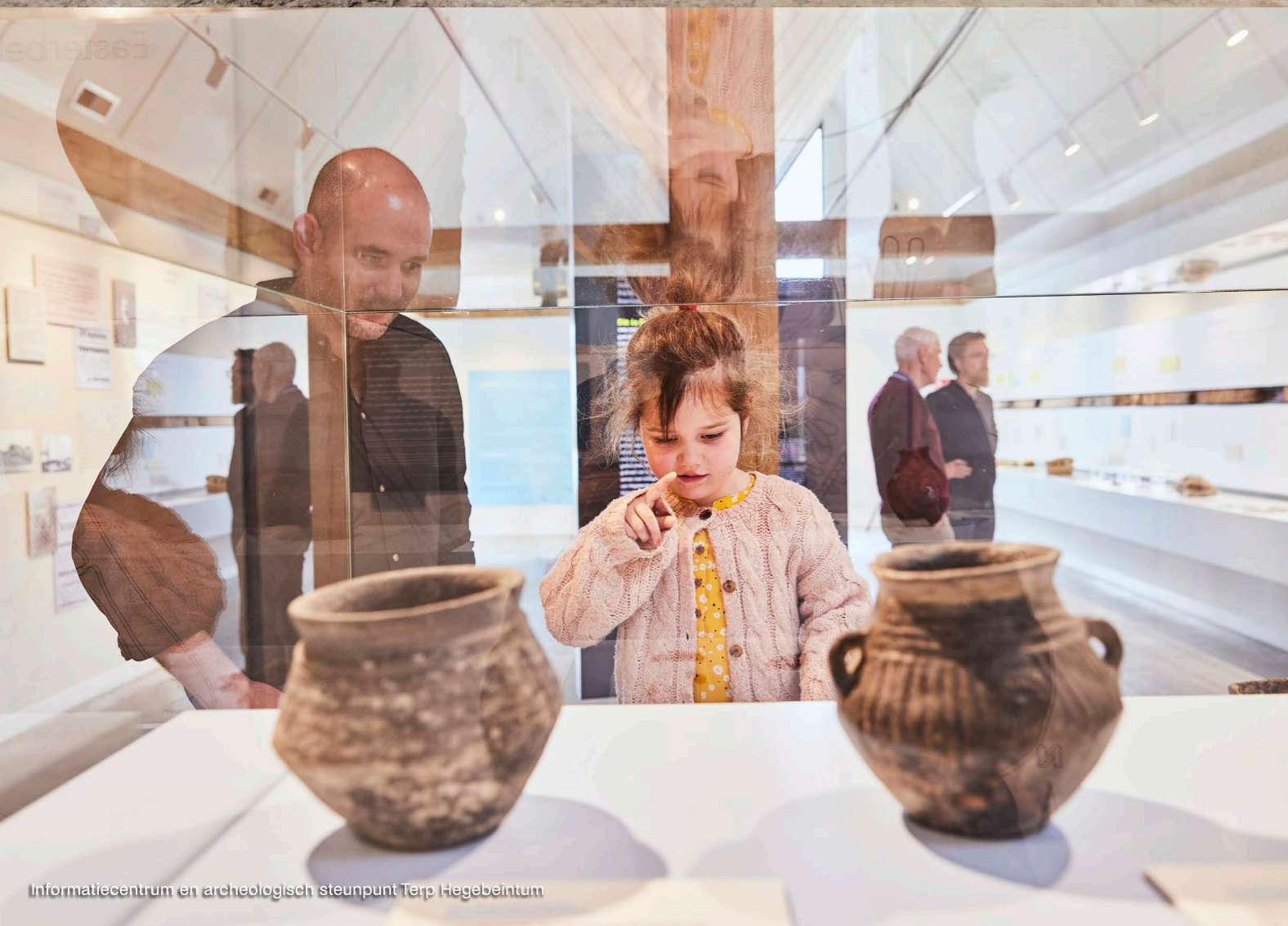
Informatiecentrum en archeologisch steunpunt Terp Hegebeintum

“Omdat de archeologische steunpunten drijven op de inzet van vrijwilligers en amateurarcheologen is structurele ondersteuning nodig.”