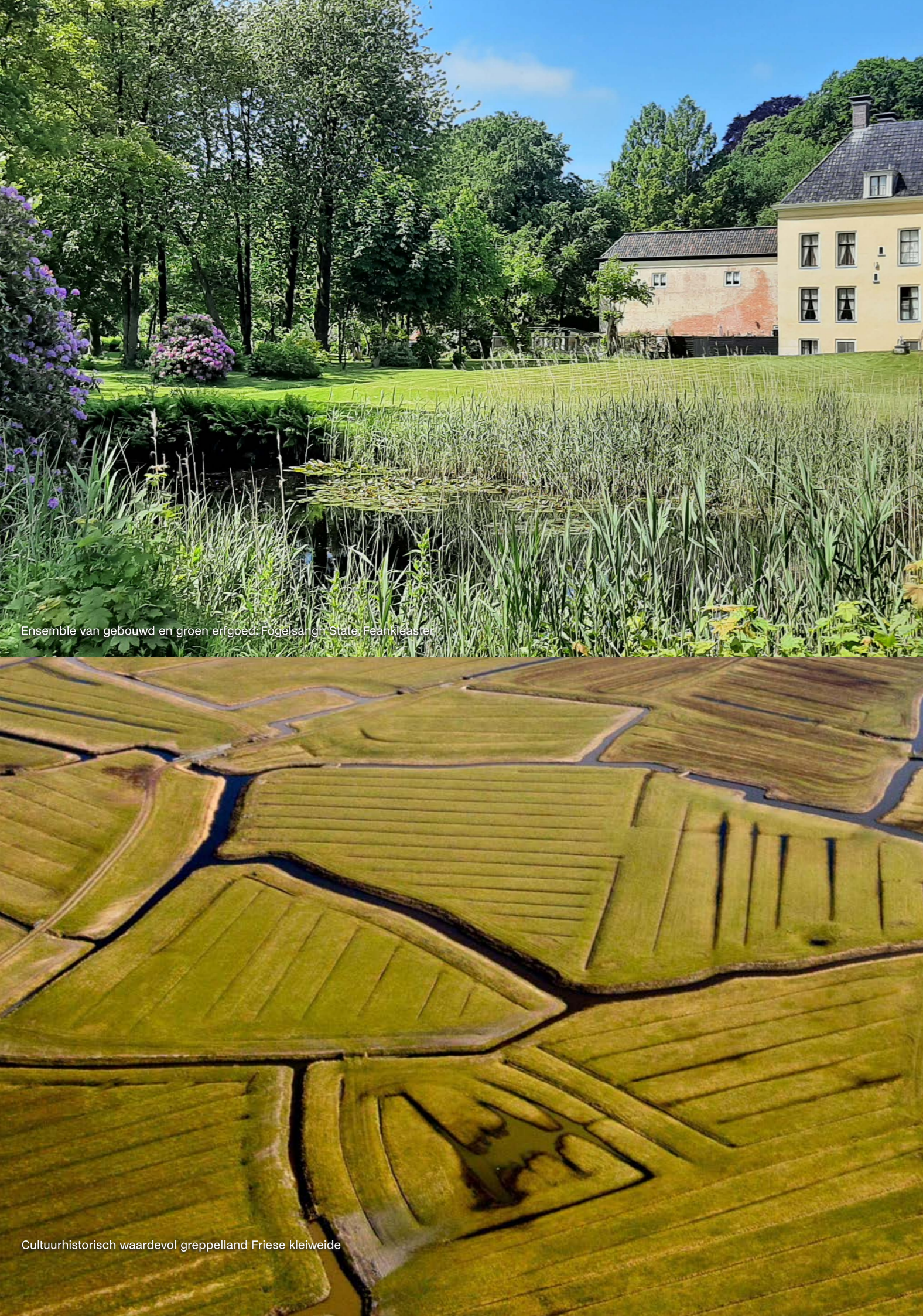
Ensemble van gebouwd en groen erfgoed: Fogelsangh State, Feankleaster

De Omgevingswet is per 1-1-2024 in werking getreden. In de Omgevingswet is cultureel erfgoed aangewezen als één van de omgevingskwaliteiten van de fysieke leefomgeving. Juist daarin zit de aanleiding om voor erfgoed een omgevingsprogramma op te stellen en niet langer te kiezen voor een aparte beleidsnota. Zo wordt samenhangend beleid op de fysieke leefomgeving bevorderd. De Omgevingswet geeft de provincie het instrument van het opstellen van een omgevingsprogramma dat is gebaseerd op de beleidsuitgangspunten van de omgevingsvisie. Naast de Omgevingswet geeft het programma ook invulling aan de wettelijke taken op grond van de Erfgoedwet.