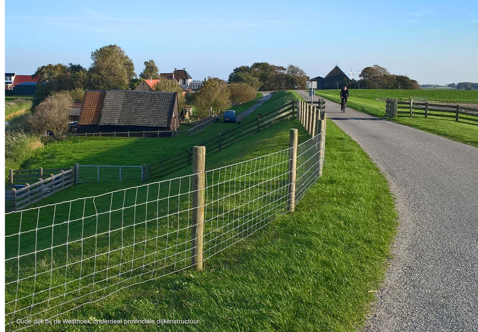
Oude dijk bij de Westhoek, onderdeel provinciale dijkstructuur