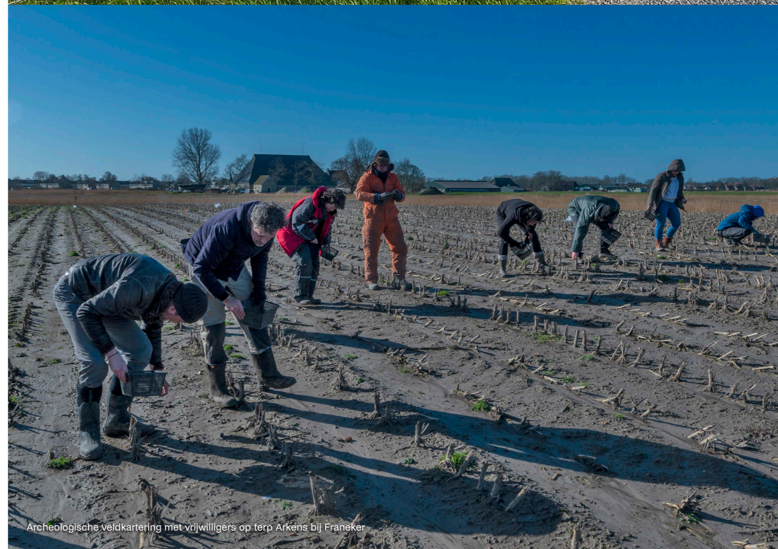
Archeologische veldkartering met vrijwilligers op terp Arkens bij Franeker