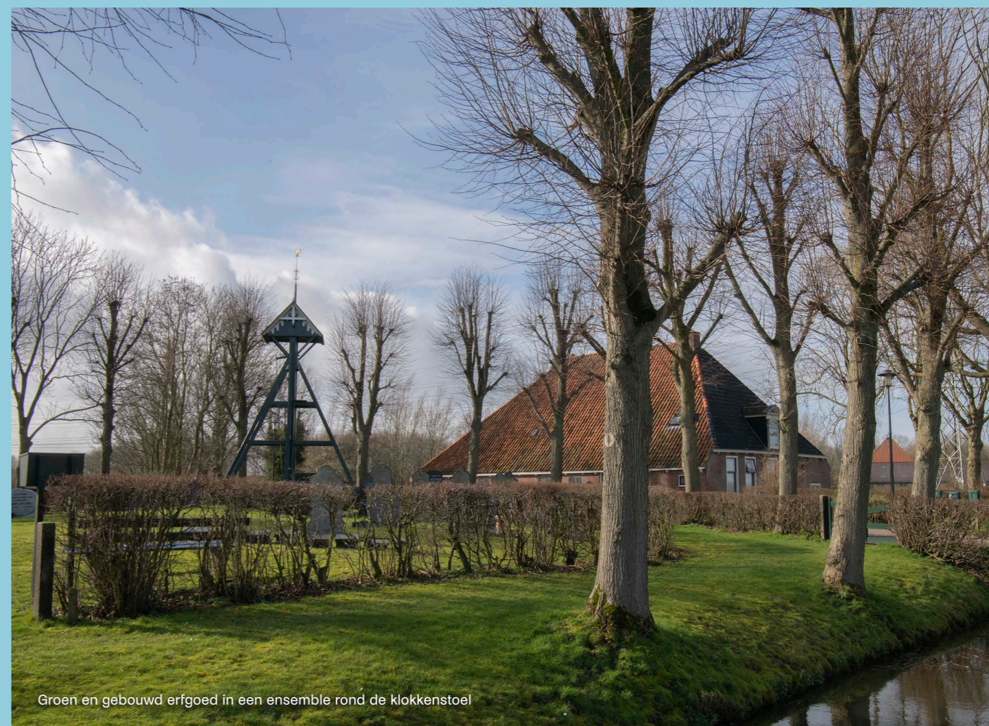
Groen en gebouwd erfgoed in een ensemble rond de klokkenstoel