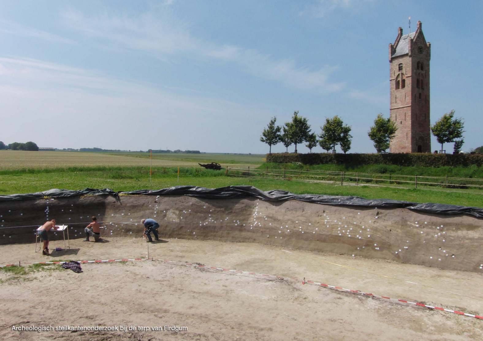
Archeologisch steilkantenonderzoek bij de terp van Firdgum