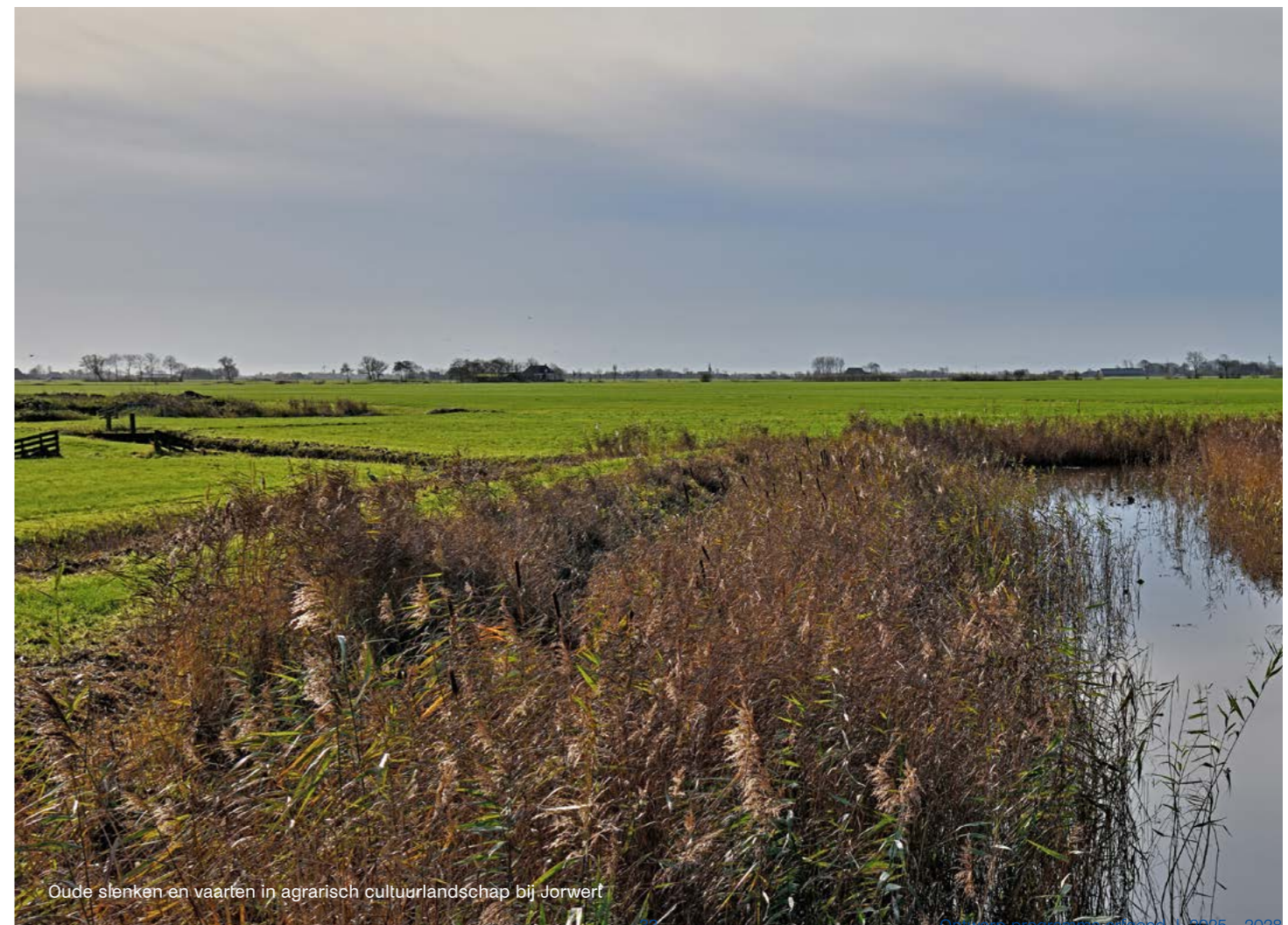
Oude slenken en vaarten in agrarisch cultuurlandschap bij Jorwert

Daarnaast is het koppelen van behoud en herstel van groen erfgoed aan specifieke programma's voor groen en natuur kansrijk. Cultuurlandschappelijke elementen zoals landgoederen, boomwallen, elzensingels, historische dijkentracés, historische vaarten en slotenpatronen kunnen een bijdrage leveren en worden tegelijk versterkt. Kansrijk zijn koppelingen aan het FPLG, bomen- en bossenstrategie en Natuurbeheerplannen waar groen erfgoed een bijdrage kan leveren aan de doelen.