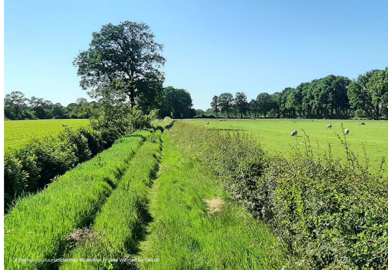
Agrarisch cultuurlandschap Noardlike Fryske Wâlden bij Twijzel

De procedure van een omgevingsprogramma staat in de Omgevingswet en bevat onder andere participatie en tervisielegging van het ontwerp. De betrokkenheid van PS is nader uitgewerkt in de brief van GS van 11 juli 2023 over de werkwijze 'vaststellen omgevingsprogramma's'. Omdat dit programma Nij Poadium opvolgt en beleidscomponenten bevat wordt PS expliciet gevraagd om wensen en bedenkingen aan te geven. Dit resulteert in de volgende na te streven planning in 2024.