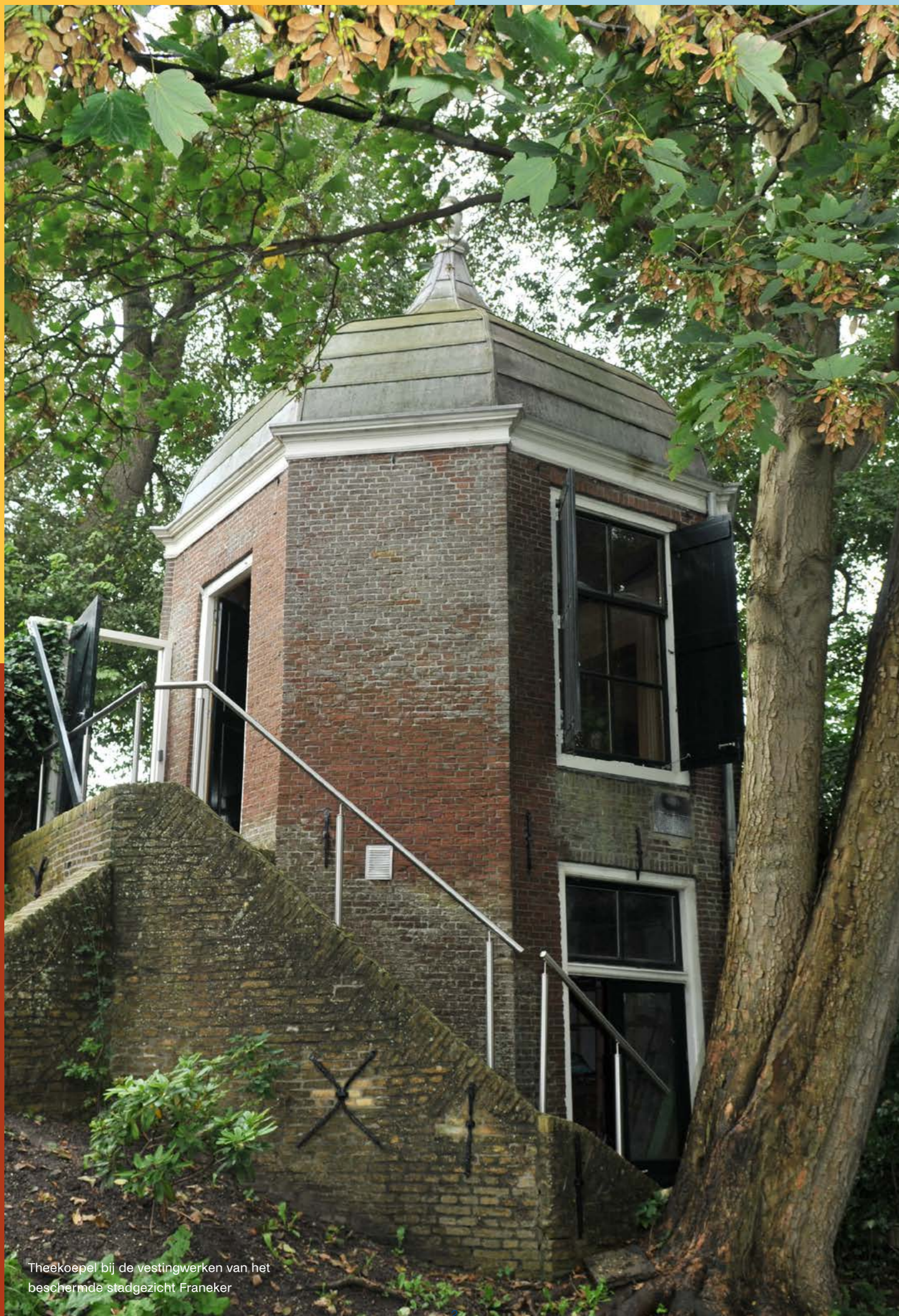
Theekoepel bij de vestingwerken van het beschermde stadgezicht Franeker