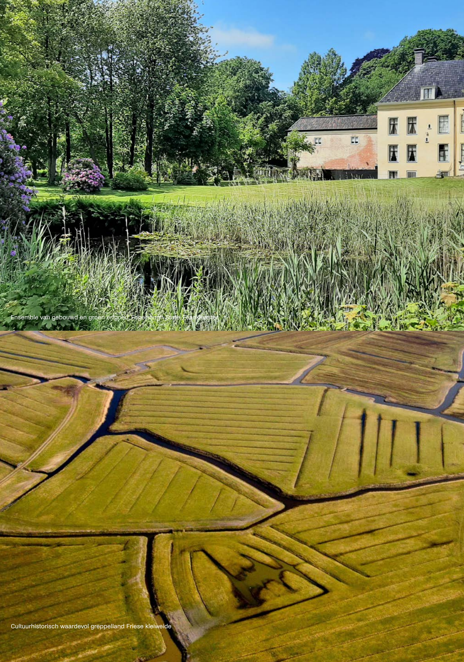
Ensemble van gebouwd en groen erfgoed: Fogelsangh State, Fean Kleaster

De Omgevingswet is per 1-1-2024 in werking getreden. In de Omgevingswet is cultureel erfgoed aangewezen als één van de omgevingskwaliteiten van de fysieke leefomgeving. Juist daarin zit de aanleiding om voor erfgoed een omgevingsprogramma op te stellen en niet langer te kiezen voor een aparte beleidsnota. Zo wordt samenhangend beleid op de fysieke leefomgeving bevorderd. De Omgevingswet geeft de provincie het instrument van het opstellen van een omgevingsprogramma dat is gebaseerd op de beleidsuitgangspunten van de omgevingsvisie. Naast de Omgevingswet geeft het programma ook invulling aan de wettelijke taken op grond van de Erfgoedwet.