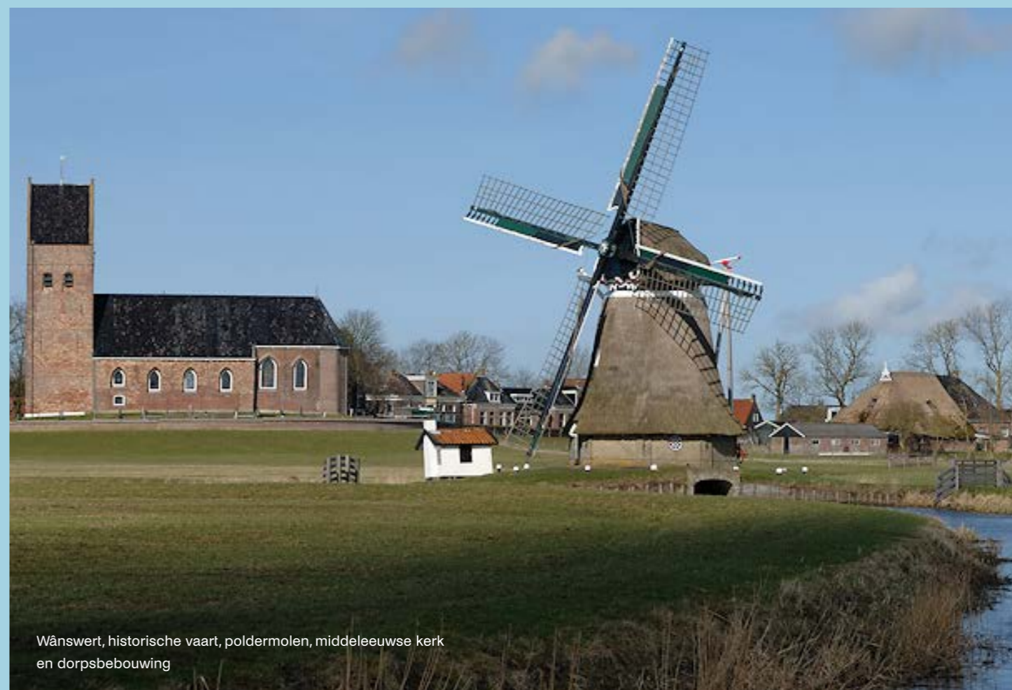
Wânswert, historische vaart, poldermolen, middeleeuwse kerk en dorpsbebouwing