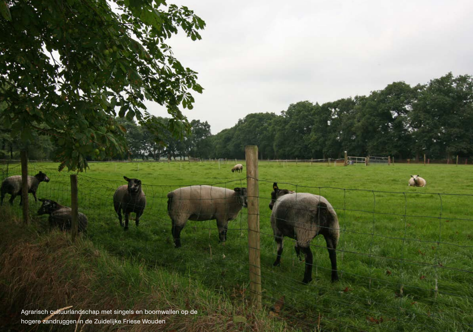
Agrarisch cultuurlandschap met singels en boomwallen op de hogere zandruggen in de Zuidelijke Friese Wouden