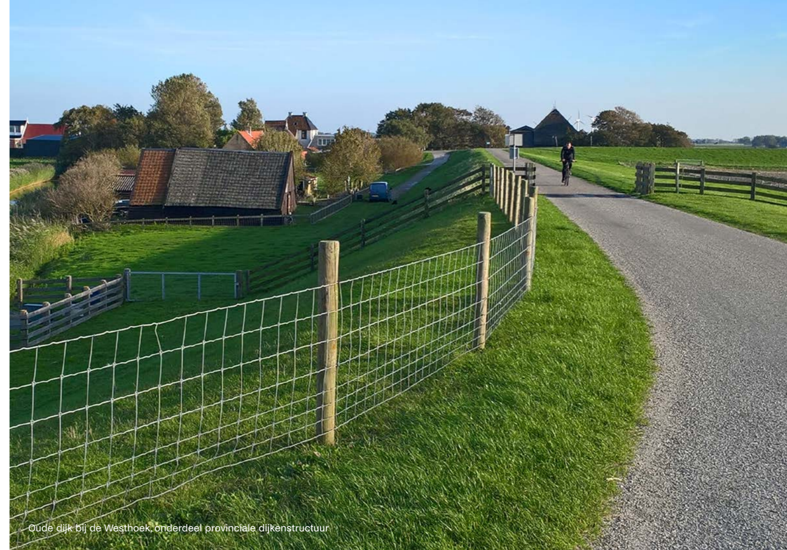
Oude dijk bij de Westhoek, onderdeel provinciale dijkstructuur