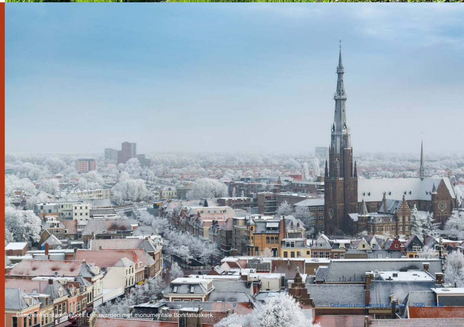
Beschermd stadsgezicht Leeuwarden met monumentale Bonifatiuskerk