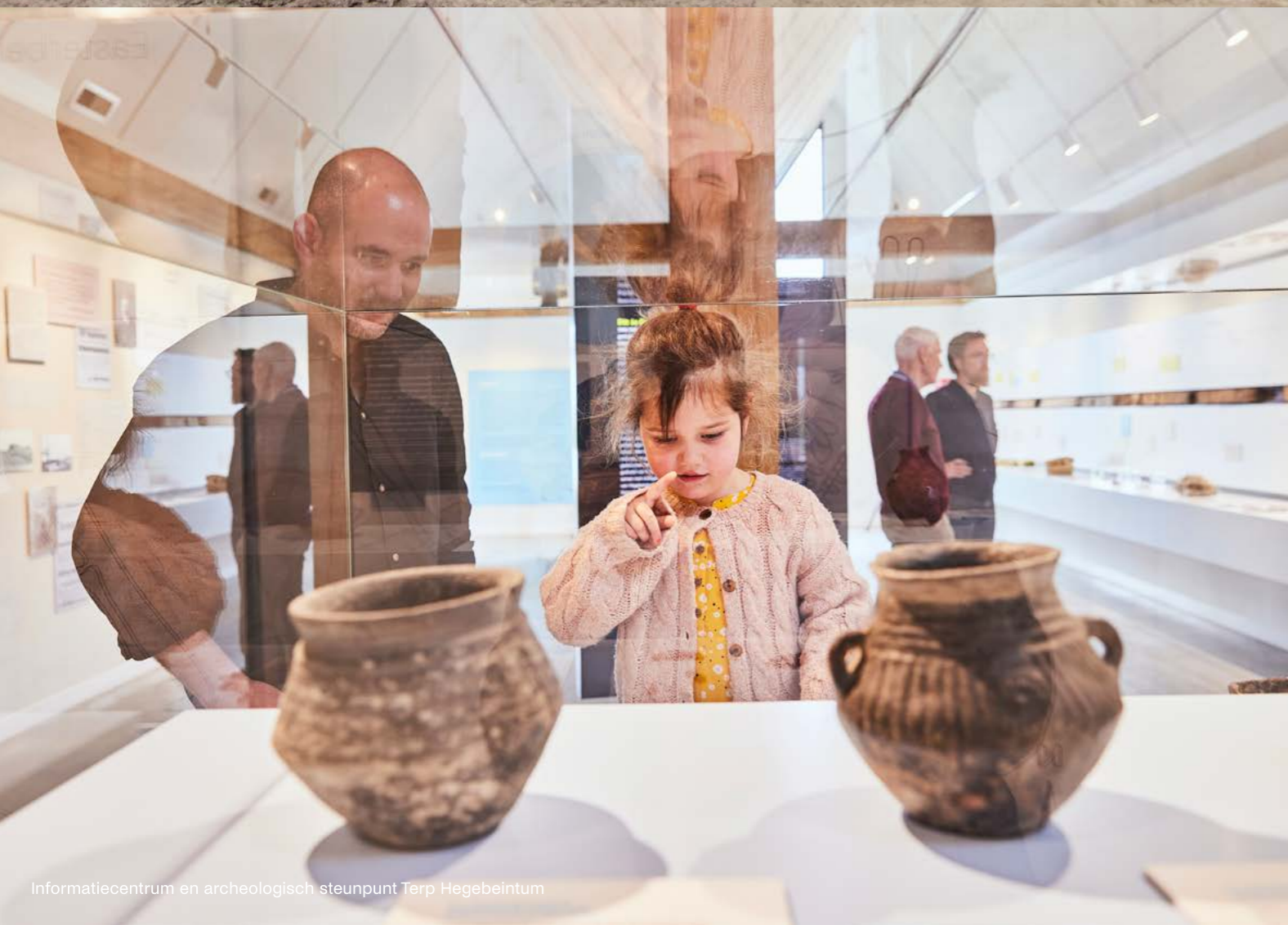
Informatiecentrum en archeologisch steunpunt Terp Hegebeintum

“Omdat de archeologische steunpunten drijven op de inzet van vrijwilligers en amateurarcheologen is structurele ondersteuning nodig.”