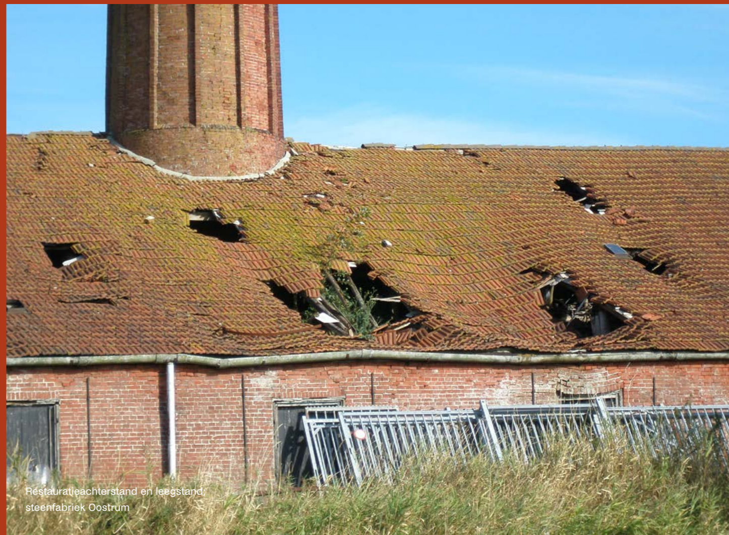
Restauratieachterstand en leegstand, steenfabriek Oostrum

Er ontstaat waardering voor Post 65-architectuur. Er is een publiekscampagne en selectieprogramma gestart voor aanwijzing tot monument. De uitkomsten worden verwerkt op de cultuurhistorische kaart en in de subsidieregeling monumenten.