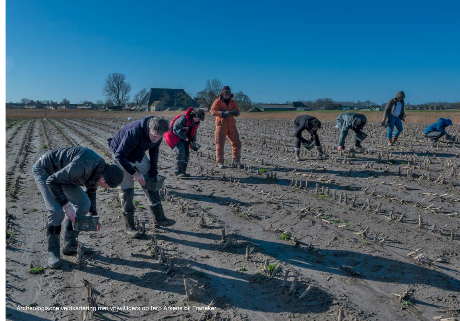
Archeologische veldkartering met vrijwilligers op terp Arkens bij Franeker