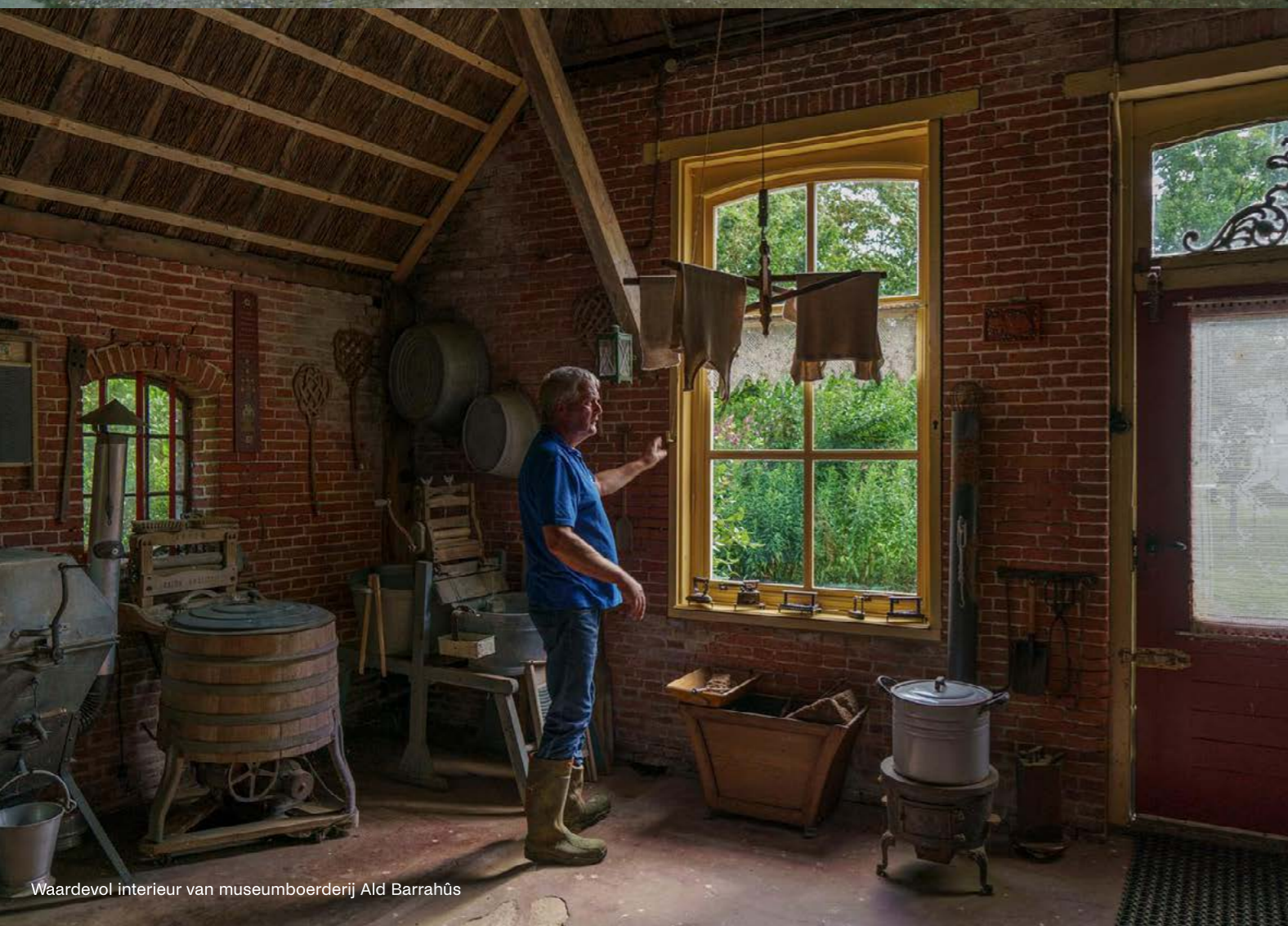
Waardevol interieur van museumboerderij Ald Barrahûs

transities zoals klimaatadaptatie, energietransitie, duurzame economie, natuur en landbouw, de woonopgave en mobiliteit. Provincies matchen hierbij het beschikbare Rijksgeld. Gestreefd wordt om bij het meekoppelen van erfgoed aan deze grote opgaven, projecten in te dienen voor de Erfgoeddeal. Provinciale matching voor het toe te kennen rijksgeld wordt zoveel mogelijk gezocht binnen de betreffende programmabudgetten.