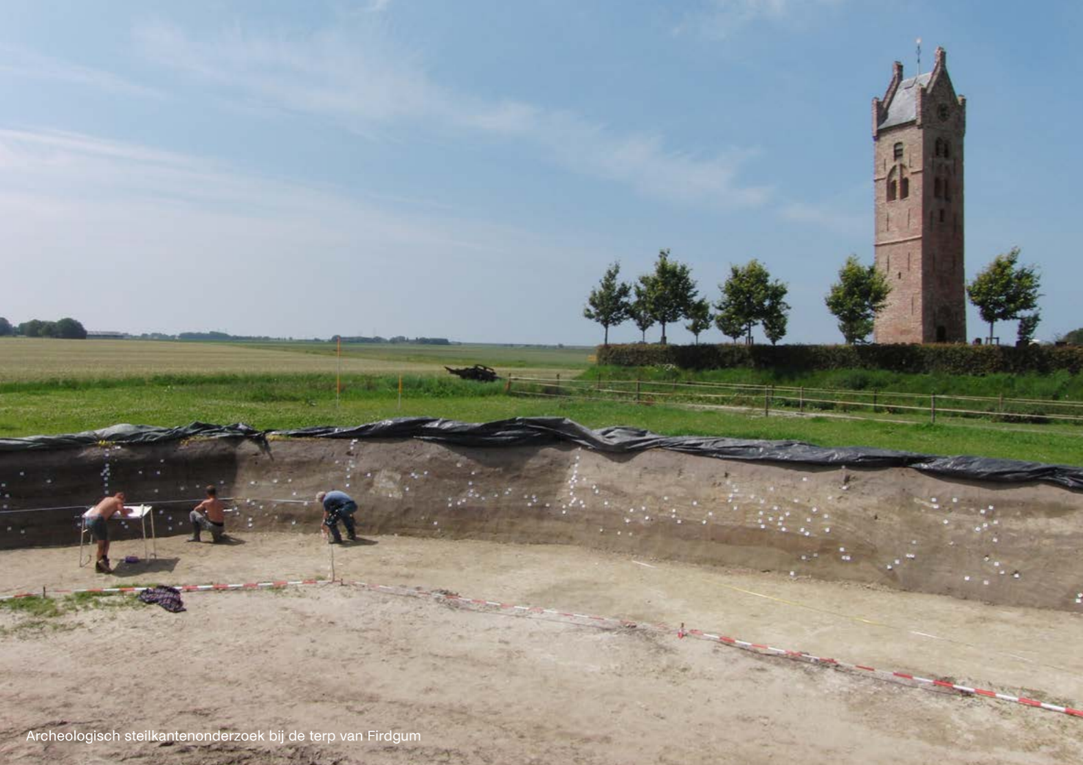
Archeologisch steilkantenonderzoek bij de terp van Firdgum