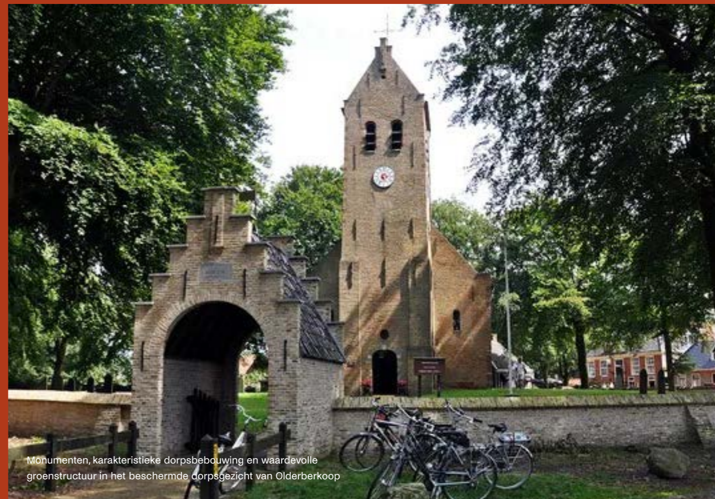
Monumenten, karakteristieke dorpsbebouwing en waardevolle groenstructuur in het beschermde dorpsgezicht van Olderberkoop

Mochten de vernieuwingen van de POVI hiervoor aanleiding geven, dan zal het programma hierop worden aangepast.