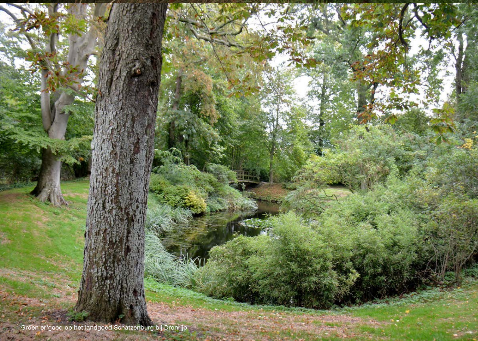
Groen erfgoed op het landgoed Schatzenburg bij Dronrijp

Dit kan ook via het agrarische natuur- en landschapsbeheer (ANLb) voor bijvoorbeeld het beheer van cultuurhistorische elementen zoals boomwallen of oud weidevogelgreppelland. Binnen de Subsidieregeling Natuur en Landschap (SrNL) kan bv. het beheer van landgoederen, parkbossen of eendekooien worden ondersteund. Ook zijn er binnen de groene programma's en regelingen mogelijkheden voor investeringsmaatregelen voor natuurherstel waaraan herstel van of inspiratie door cultuurlandschap of groen erfgoed kan worden gekoppeld. Tenslotte is er een kansrijke koppeling te maken met openstellingen voor subsidiëring van zogenaamde niet-productieve investeringen in het kader van het Gemeenschappelijk Landbouw Beleid (GLB) waarbij onder andere elzensingels, lanen, erfbeplanting en greppelland kunnen worden hersteld.