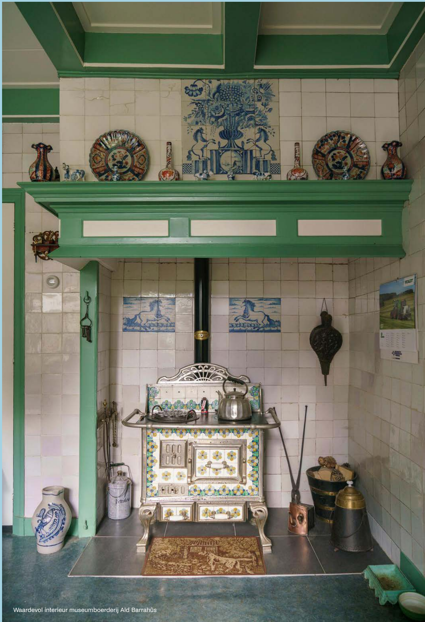
Waardevol interieur museumboerderij Ald Barrahûs