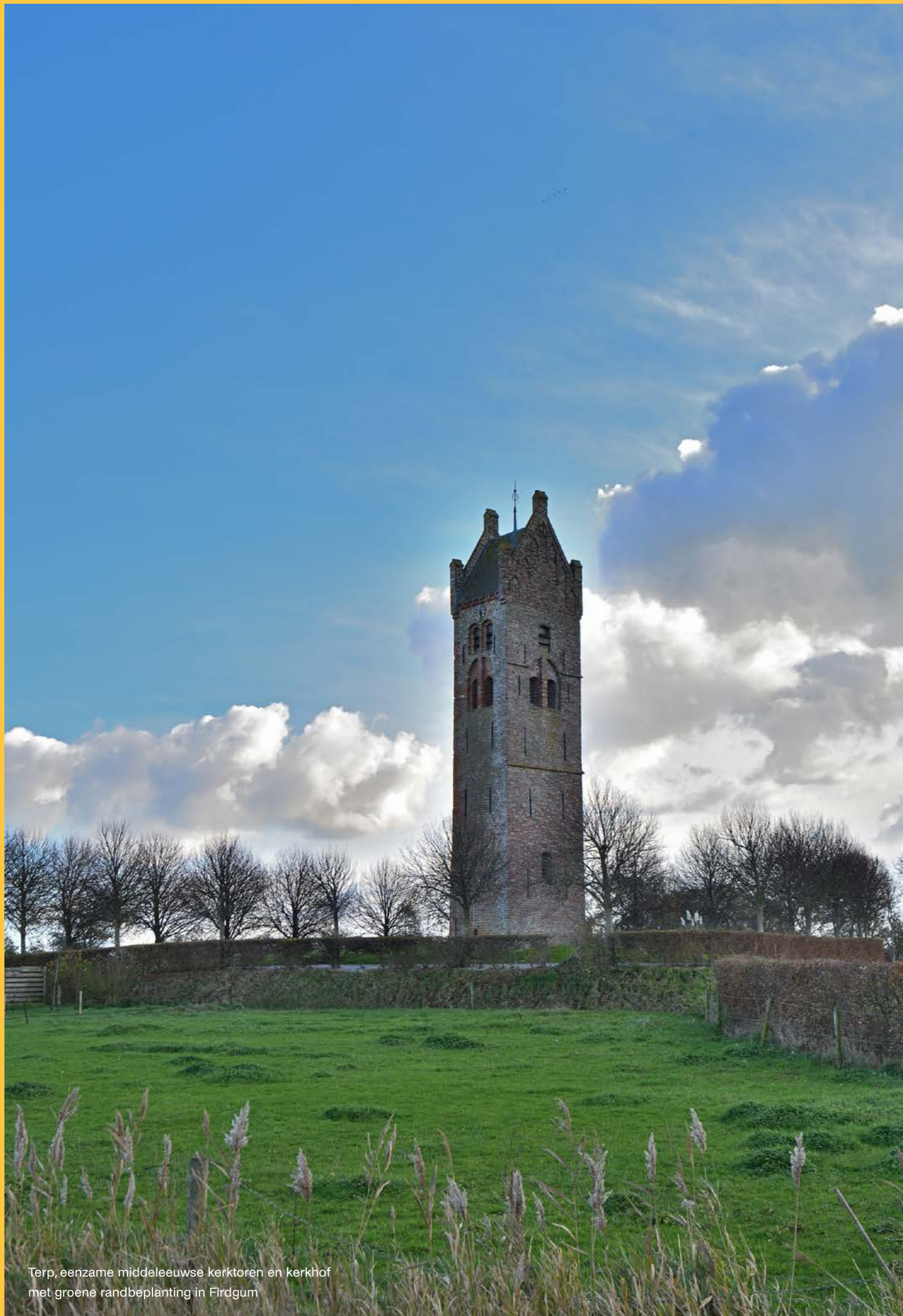
Terp, eenzame middeleeuwse kerktoren en kerkhof met groene randbeplanting in Firdgum