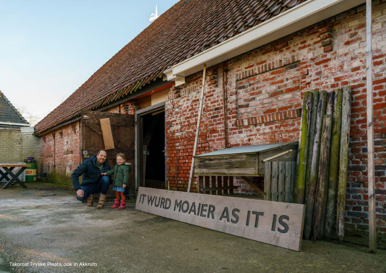
Takomst Fryske Pleats, ook in Akkrum