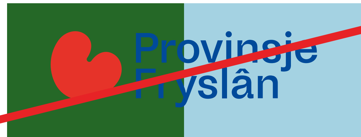
Full color logo op kleurvlakken.