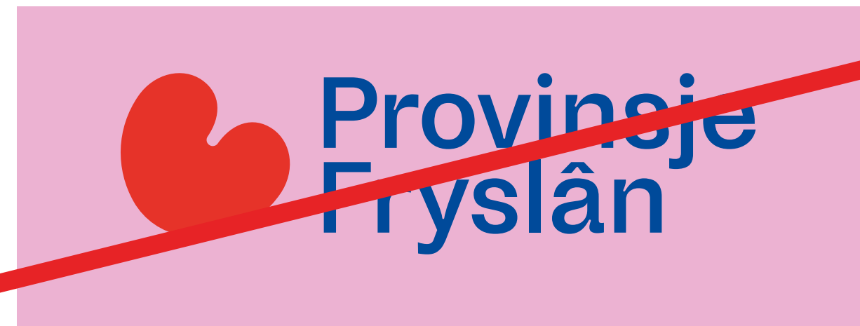
Full color logo op een kleurvlak.