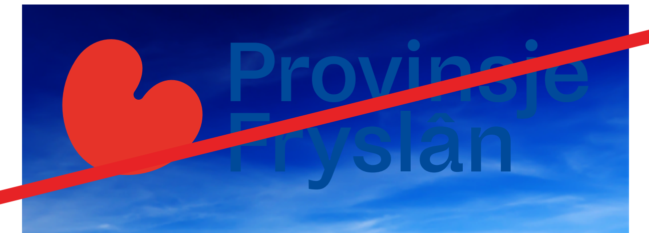
Te weinig contrast met achtergrond