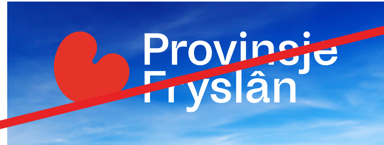
Verkeerde kleuren gecombineerd.