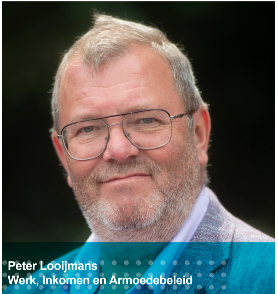
Peter Looijmans Werk, Inkomen en Armoedebeleid

Het is de bedoeling dat we hulp op maat gaan bieden. Hiervoor gaan we eerst in gesprek met onze inwoners die moeite hebben met rondkomen. Zij kunnen contact met ons opnemen. Samen bespreken we wat mogelijk is. Zo bekijken we samen hoe er nog meer bezuinigd kan worden en of er nog toeslagenregelingen zijn waar gebruik van kan worden gemaakt. Mocht er dan nog een tekort zijn, dan springen we ook financieel bij. Dus echt hulp op maat. We willen zoveel mogelijk mensen helpen. We steken daarom als gemeente extra veel geld en energie in deze koopkrachtreparatie. Het is belangrijk dat deze boodschap bij onze inwoners binnenkomt. Hulp is mogelijk, maar we moeten dan wel in contact met elkaar komen'