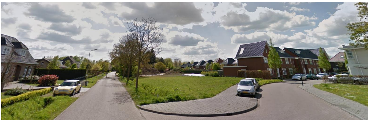
Zicht op de Loeswijk (links) en nieuwbouwwijk (rechts)