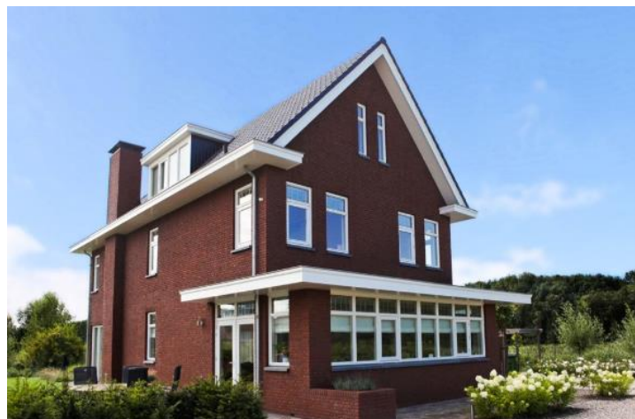
Zadeldak met grote overstek