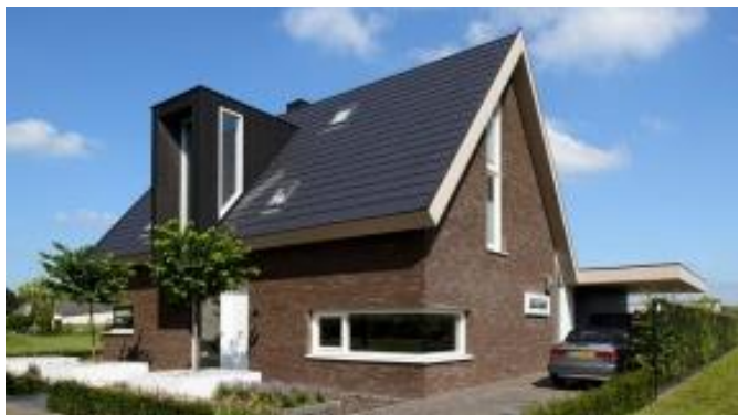
Toepassing hout, lichte ondergeschikte bouwdelen, eigentijdse architectuur