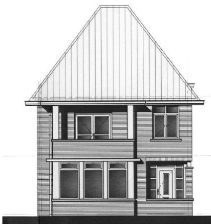
Woningtype vrijstaande woning

De 'entreewoning' krijgt twee bouwlagen met kap, met ruimte voor bijzondere elementen zoals een erker en entree. De goothoogte bedraagt maximaal 6,5 meter en de bouwhoogte maximaal 10 meter. De voorgevel is georiënteerd op de weg. Mogelijke kapvorm is zadeldak, met daarbij grote overstekken.