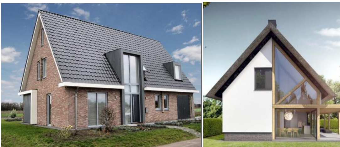
Raampartij toegepast in bouwdeel en als onderdeel van de constructie

De woningen bestaan uit 1 tot 1,5 bouwlagen en een kap. Daarbij is sprake van een verspringende goothoogte. De goothoogte bedraagt maximaal 4 meter en de bouwhoogte maximaal 10 meter. De voorgevel en kap zijn georiënteerd op de weg. De woning is daarbij samenhangend vormgegeven, waarbij enorme raampartijen enkel toegepast mogen worden als uitvoering van een modern bouwdeel.