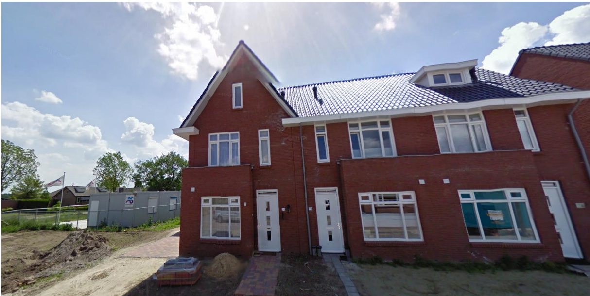
Nieuwbouwwoningen Loeswijk, rode bakstenen

Een eventuele garage dient qua architectuur aan te sluiten op de hoofdmassa. Ook de bijzondere elementen zoals erkers dienen onderschikt aan de hoofdmassa te zijn en opgetrokken uit dezelfde materialen.