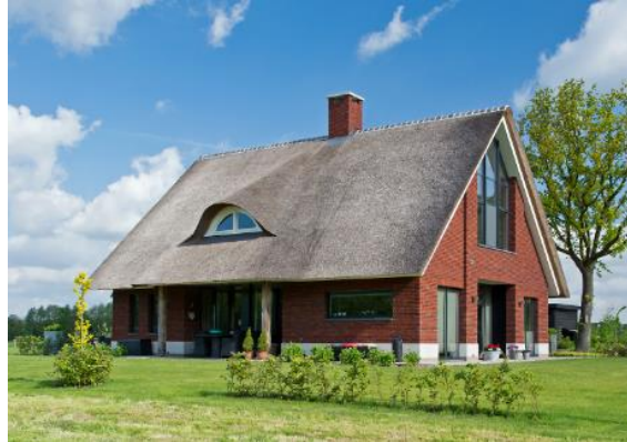
Zadeldak van riet met ondergeschikt dakraam