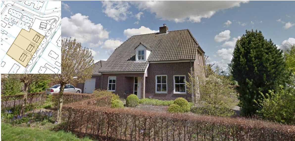
Woning aan de Loeswijk 34, verspringende goot, dakkapel ondergeschikt aan dak en raampartijen