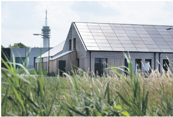
De parkeerplaatsen van de zestien bio based woningen aan de Schaatsenrijder (Compaen) zijn onlangs aangelegd met grasbetonplaatsen.

Het bestemmingsplan Fazantlaan-West wordt op 16 september 2024 voorgelegd aan de gemeenteraad voor vaststelling. Bij deze raadsvergadering wordt ook de nota zienswijze behandeld, met daarin de beantwoording van zienswijzen die we op dit plan hebben ontvangen. Hiervoor wordt het inrichtingsplan behandeld in de commissie Ruimte. Dit vindt plaats op 26 augustus. U kunt daar eventueel inspreken.