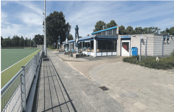
Het huidige clubgebouw van HC Mierlo.

Er is tegen dit bestemmingsplan geen beroep ingesteld bij de Raad van State. Dat betekent dat dit bestemmingsplan onherroepelijk is geworden. En dat is natuurlijk goed nieuws!