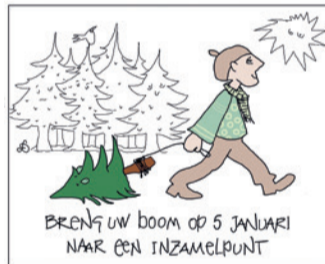
Illustratie: Liesbeth Dirkse