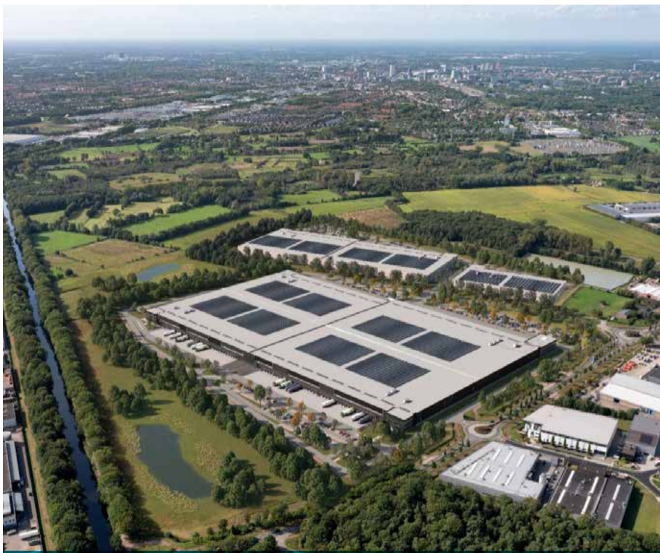
Impressie van het distributiecentrum met links van het kanaal bedrijventerrein De Spaarpot en rechts van het kanaal de nog te bouwen distributiecentra in Nuenen.

Dit blijkt ook uit het onderzoek wat Adviesbureau Royal HaskoningDHV de afgelopen maanden heeft uitgevoerd voor het opstellen van de Lokale Bereikbaarheidsagenda. Onderdeel hiervan is een verkeersonderzoek naar de gevolgen van ruimtelijke ontwikkelingen, binnen en buiten onze gemeentegrenzen. Hierin zijn ook modelberekeningen gemaakt met daarin de gevolgen van de ontwikkeling van Eeneind-West. Royal HaskoningDHV verwacht dat de hoofdwegen in Geldrop-Mierlo in 2030 een hoge belasting gaan kennen, ondanks de inzet van de regio en gemeente op meer fiets, OV en deelmobiliteit in de periode 2019-2030. Vooral op het Bogardeind in Geldrop wordt de verkeersbelasting ten opzichte van de beschikbare capaciteit kritisch. Uit de berekeningen blijkt bovendien dat wanneer er op Eeneind-West een gemengd bedrijventerrein of distributiecentrum komt er vooral op het zuidelijke deel van het Bogardeind in Geldrop nieuwe knelpunten ontstaan in de verkeersafwikkeling. De verwachting is dat hierdoor de verkeersafwikkeling in 2030 bij de noordelijke rotonde ter hoogte van de aansluiting op de A67 problematisch wordt met een forse terugslag op de aansluitende wegvakken tot gevolg. Daarbij ontstaat het risico dat een bereikbaarheidsprobleem uitgroeit naar een veiligheidsrisico bij de spoorwegovergang Emopad en de zuidelijke afrit van de A67 (vanwege het snelheidsverschil op de hoofdrijbaan bij filevorming).