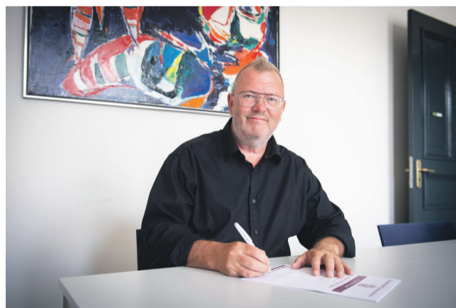
persoonlijke ontwikkeling. Kortom: voor iedereen die mee wil doen!

Het Dorpsleerbedrijf staat open voor iedereen die graag meedoet in onze samenleving. Het Dorpsleerbedrijf bevordert maatschappelijke deelname, sociale activering en