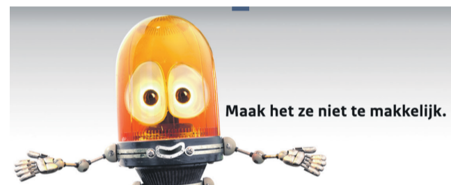
Maak het ze niet te makkelijk.

Senioren worden helaas steeds vaker slachtoffer van oplichters. Oplichters verzinnen steeds weer nieuwe manieren om mensen van hun privégegevens of bezittingen te beroven. Denk in de coronatijd aan verplegers die bij de mensen thuis komen prikken of bankmedewerkers die bij u langkomen omdat u niet zelf naar de bank kunt komen. Iedereen kan slachtoffer worden van dergelijke trucs, ook ouderen. In de komende weken besteden we in een aantal artikelen aandacht aan verschillende vormen van criminaliteit waar ouderen regelmatig slachtoffer van worden. We hopen dat senioren zich hierdoor meer bewust worden van dit soort praktijken, uiteraard geven we ook tips en adviezen. Deze week: babbeltucs.