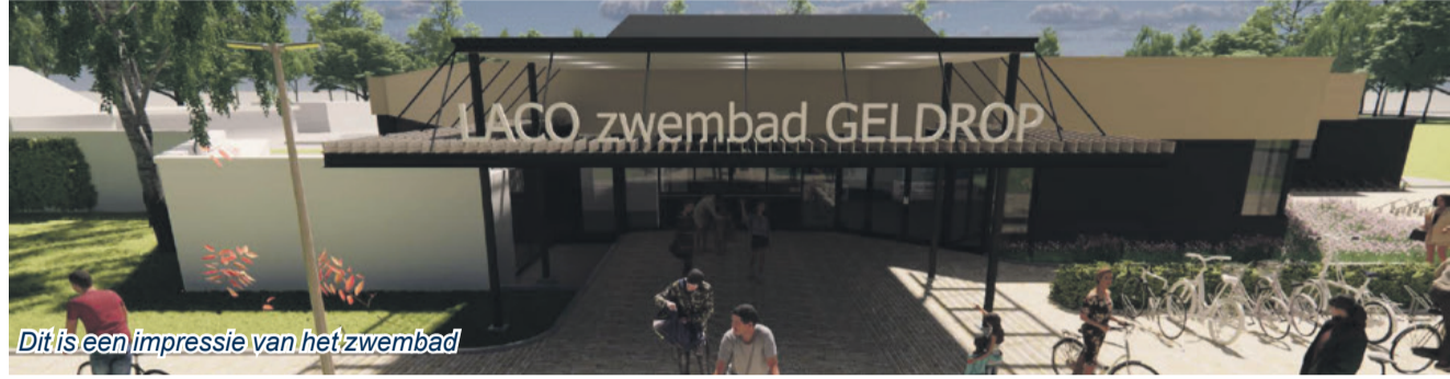
Dit is een impressie van het zwembad

Na goedkeuring van de gemeenteraad op 26 september gaat Sportfondsen aan de slag met het aanpakken van de huidige zwemvoorziening. De focus hierbij komt te liggen op de renovatie en verduurzaming van het binnenbad omdat dit het gehele jaar in gebruik is. Door de toegenomen omvang en kosten van de renovatie en verduurzaming van het binnenbad wordt het buitenbad in beperkte uitvoering gerenoveerd. De waterzuiveringsinstallaties van het buitenbad zijn al gerenoveerd en de voor publiek zichtbare onderdelen, zoals groenvoorzieningen, straatwerk en hekwerk zijn of worden nog aangepakt. Ten slotte worden alle maatregelen getroffen om zwembad De Smelen energiezuiniger te maken. Denk hierbij aan het verbeteren van (dak) isolatie, het plaatsen van PV-panelen op het dak en het vervangen van de huidige ramen door HR++ ramen.