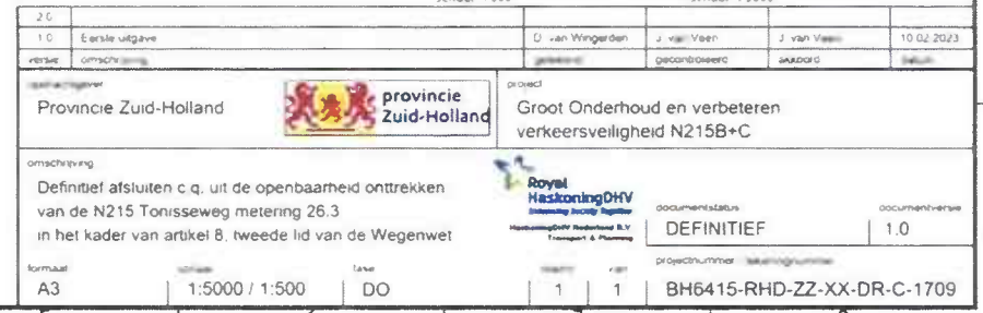
DETAIL A Schaal: 1500