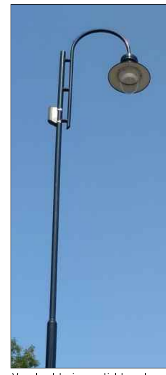
Voorbeeld nieuwe lichtmast