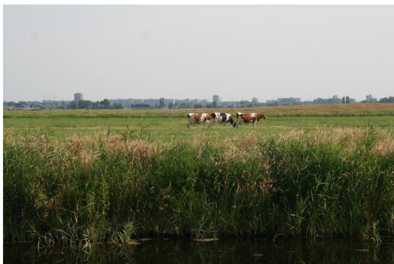
Het landschap van Midden-Delfland, met 'koe in de wei', omringd door het stedelijk gebied. Niet voor niets is het versterken van de stad-landrelatie naast de kwaliteit van het landschap één van de twee doelstellingen van het Groenfonds.

De jaarrekening is ingericht in overeenstemming met de in Nederland geldende richtlijn C1 voor de jaarverslaggeving "Organisaties zonder winststreven" voor kleine organisaties.