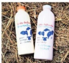
▲ Boeren maken vaak eigen melk en yoghurt.