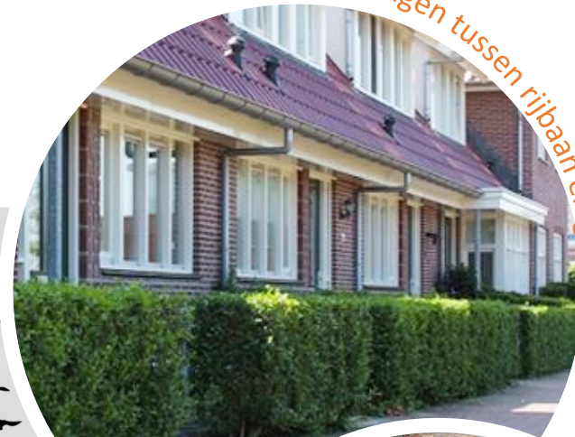
Blokhagen tussen rijbaan en gevel