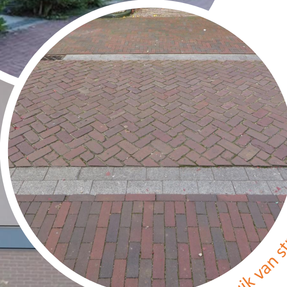
Hergebruik van straatstenen.