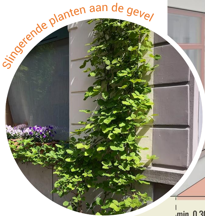
Slingerende planten aan de gevel