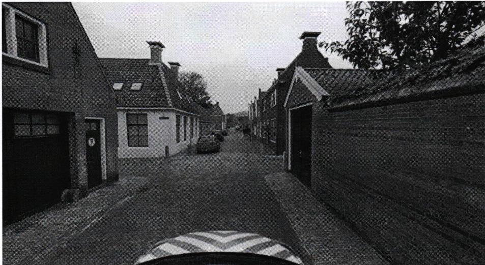
Figuur 1: Karremanstraat.

Zowel uit de risicoanalyse in het kader van SPV2030 als uit data qua verkeersongevallen zijn er geen signalen om de Karremanstraat met prioriteit aan te pakken. Zo zijn de inrichting en gebruik van de weg in evenwicht.