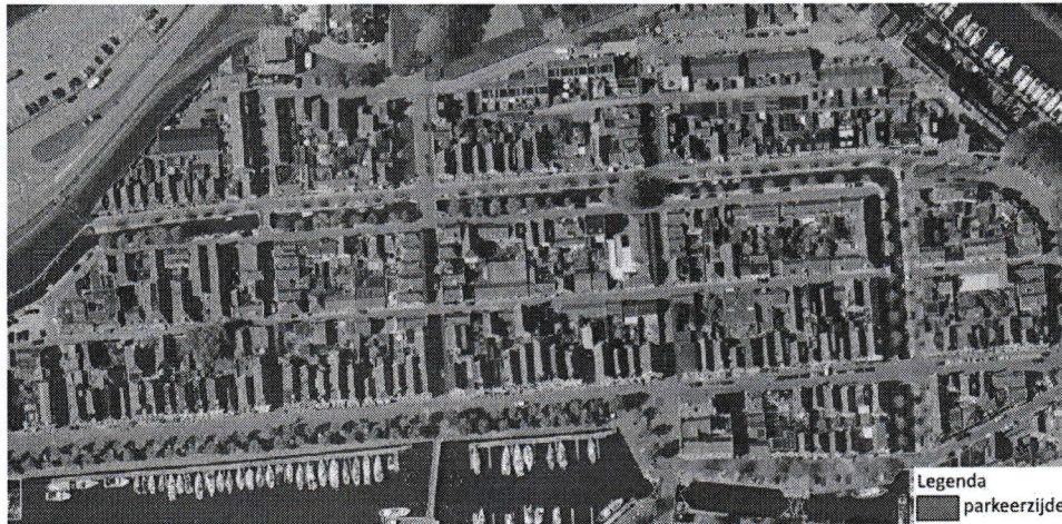
Figuur 3: Wegasverspringing door regulering parkeren.