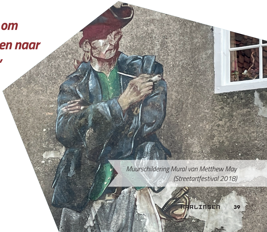
Muurschildering Mural van Matthew May (Streetartfestival 2018)

“Er zijn volop kansen om toeristen en recreanten naar Harlingen te trekken”