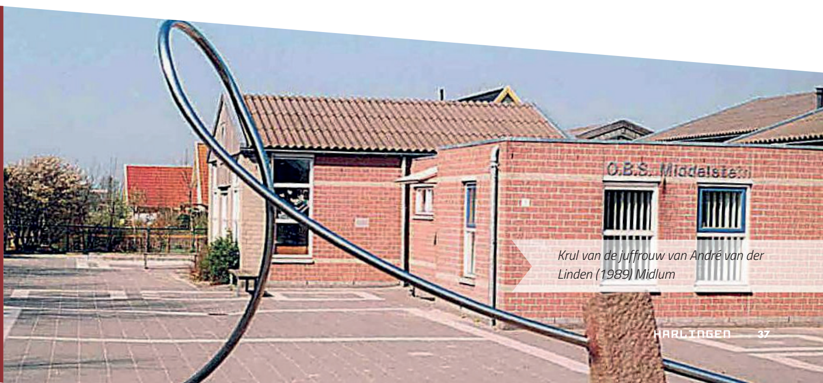
Krul van de juffrouw van André van der Linden (1989) Midlum