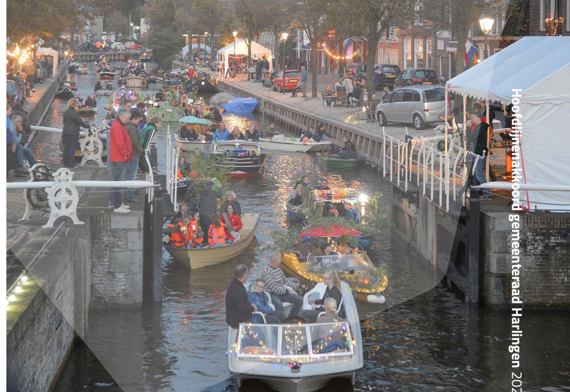
Hoofdlijnakkoord gemeenteraad Harlingen 2022-2026

Specifiek voor Spijkerstad heeft de gemeenteraad het streven om tot een vaste locatie te komen. Voor dit type evenementen en breder wil de raad een betere ondersteuning voor initiatiefnemers daarvan. Startend met het invoeren van een servicepakket van de gemeente voor de organisatoren van evenementen in de gemeente.