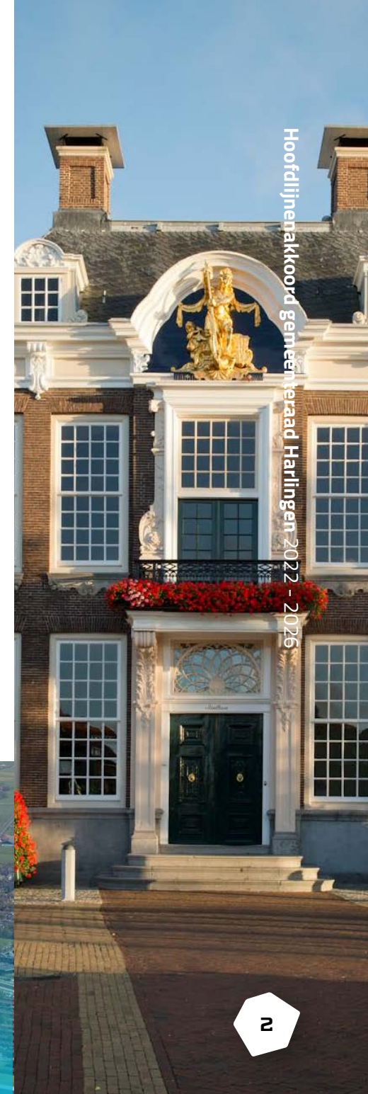
Hoofdlijnenakkoord gemeenteraad Harlingen 2022 - 2026