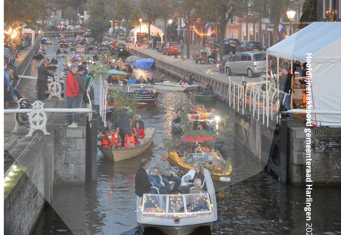
Hoofdfijnakkoord gemeenteraad Harlingen 2022-2026

Specifiek voor Spijkerstad heeft de gemeenteraad het streven om tot een vaste locatie te komen. Voor dit type evenementen en breder wil de raad een betere ondersteuning voor initiatiefnemers daarvan. Startend met het invoeren van een servicepakket van de gemeente voor de organisatoren van evenementen in de gemeente.