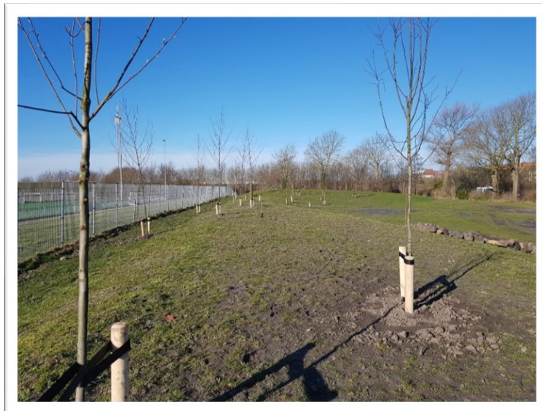
Het planten van bomen en struiken is in volle gang

Na een periode van intensief plannen maken, in nauwe samenwerking met de werkgroep Balklandpark Noord, is de aanleg van het park in volle gang. De werkgroep is inmiddels omgevormd tot de Stichting Ecologisch Stadspark Harlingen en is volop betrokken bij de uitvoering.