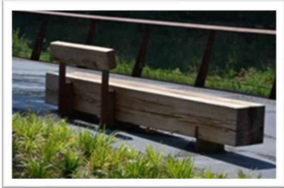
Voorbeeld te plaatsen banken

Op verschillende plekken in het park worden ook rustpunten gemaakt door het plaatsen van mooie, robuuste banken. Deze worden door lokale Harlinger ondernemers gemaakt en geplaatst. Bij de ingang van het park wordt een watertappunt geplaatst, zodat zowel de actieve sporter als mensen die in het park recreëren daar schoon drinkwater kunnen halen.