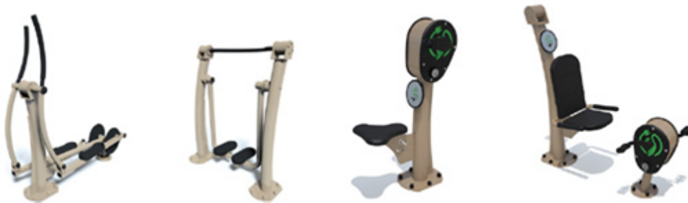
Voorbeelden van type beweegtoestellen

Een ander deel van het park is meer gericht op actief bezig zijn. Op sporten, spelen en bewegen. Onderdeel van het ontwerp zijn verschillende speel- en beweegtoestellen. De plaatsing daarvan is gepland in april, zodat die komende zomer volop gebruikt kunnen worden. Hieronder voorbeelden van het type te plaatsen toestellen.