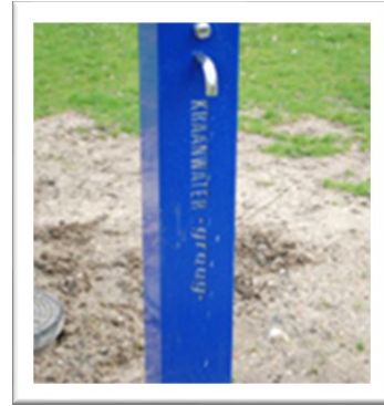
Watertappunt voor schoon drinkwater