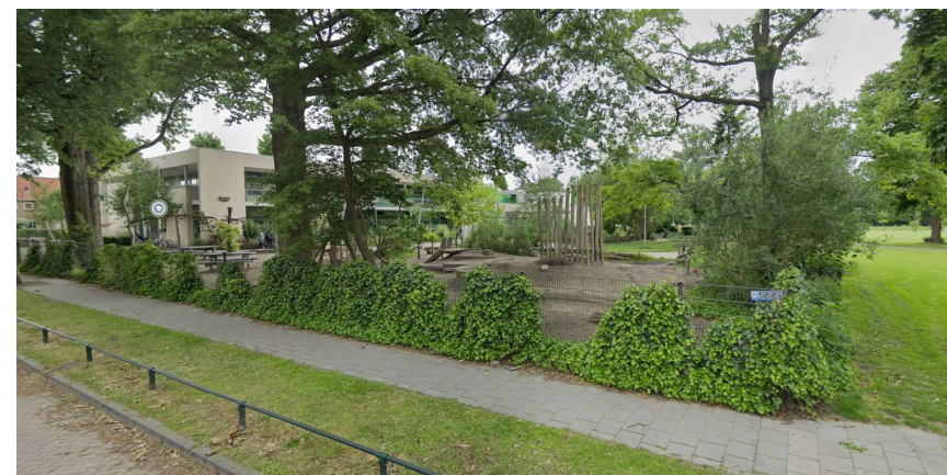
Figuur 7: Voorbeeld openbaar speelpark basisschool Strijp Dorp in Eindhoven