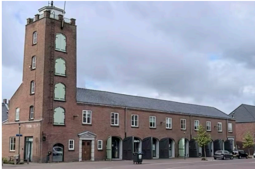
Figuur 4: Voorbeeld van een nieuwe functie van een monument. Hierboven de oude Kazerne in Kaatsheuvel

Er wordt ingezet om het pand te behouden en duurzaam te ontwikkelen. De begane grond is toegankelijk voor inwoners, maatschappelijke functie of horeca ('theetuin' of vorm van horeca die geen zichtlocatie nodig heeft) die niet concurreert met het bestaande programma in de omgeving. Faciliteiten voor evenementen worden opgenomen, denk aan toiletten, keuken e.d. Dit kan ook door middel van slim dubbelgebruik van voorzieningen in het pand. Op de verdieping is eventueel ruimte voor enkele appartementen voor starters. Het toevoegen van woningen zorgt voor sociale controle in de omgeving. Het toevoegen van woningen in bestaande gebouwen mag geen belemmering zijn voor de evenementen die in het gebied gehouden worden. De parkeerplaatsen op de binnenplaats kunnen ruimte maken voor een (collectieve) tuin. Een maatschappelijke functie op de verdieping zou ook kunnen. De functies dienen te passen binnen het vigerende bestemmingsplan, met de functie 'centrum'. Bestemmingen daarbinnen zijn: wonen, detailhandel, dienstverlening, kantoor, ondersteunende horeca, maatschappelijke voorzieningen- en daghoreca (cat. 1).