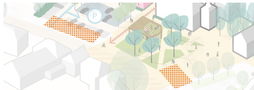
Figuur 2: Indicatieve weergaven van de tribunes op de Brabantsedag

De nieuwe inrichting van het plein en de herinrichting van de Jan Deckersstraat en Kapelstraat hebben beide een andere ontwikkelsnelheid. Er zijn echter een aantal raakvlakken, zoals de locatie van de toegang tot het parkeerterrein. Deze kan door de nieuwe inrichting van het plan enigszins verschuiven. Daarnaast ligt er een nog te maken ontwerpkeuze voor of de straat langs het plein loopt of dat de straat onderdeel wordt van het plein.