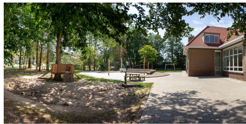
Figuur 8: Voorbeeld openbaar speelpark basisschool De Es in Hellendoorn