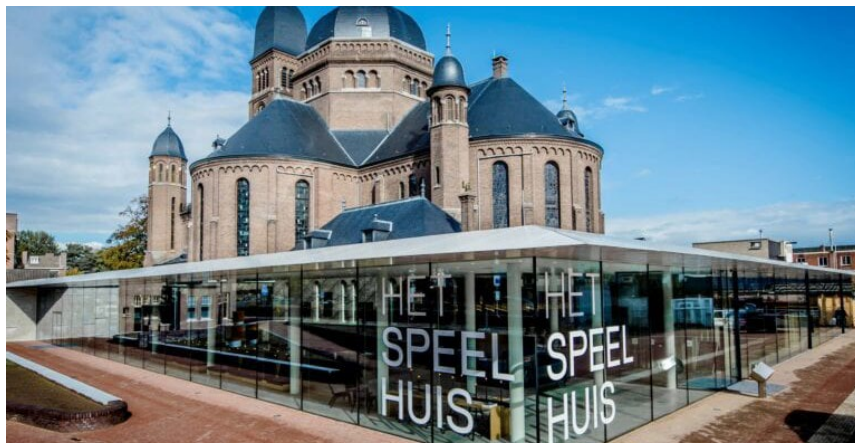
Figuur 3: Voorbeeld van een nieuwe functie en toevoeging aan een monument. Hierboven Het Speelhuis in Helmond

De functies dienen te passen binnen het vigerende bestemmingsplan-, met de functie 'centrum'. Bestemmingen daarbinnen zijn: wonen, detailhandel, dienstverlening, kantoor, ondersteunende horeca, maatschappelijke voorzieningen en daghoreca (cat 1).