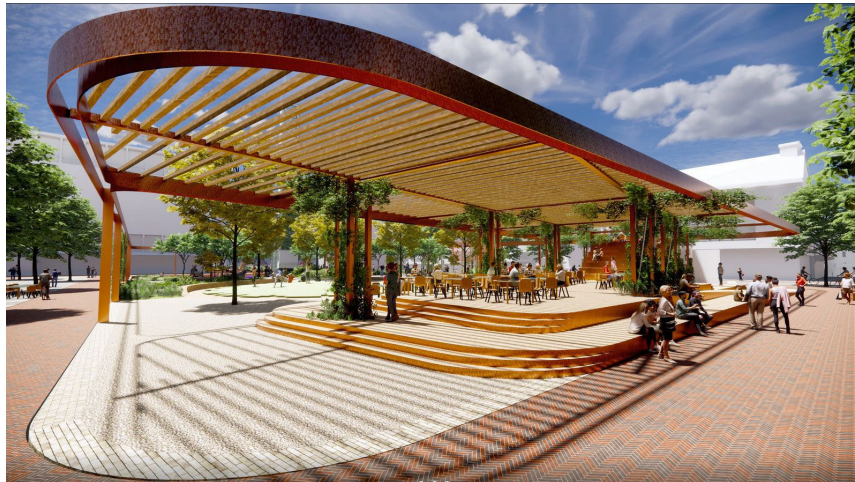
Figuur 1: Voorbeeld van een toekomstig paviljoen in Hengelo

Voor de ingang van het gemeentehuis is ruimte voor een ruime entree. Dit is een belangrijk gebouw in aanzien en functie aan het plein. De warenmarkt behoudt hier haar functie. Geleidelijk vergroent deze zone waardoor het gebied een schakel vormt met de gemeentehuistuin aan de achterzijde. De parkeerplaatsen maken plaats voor groen, de autoverbinding komt te vervallen (ontsluiting via Spoorlaan) en er komt