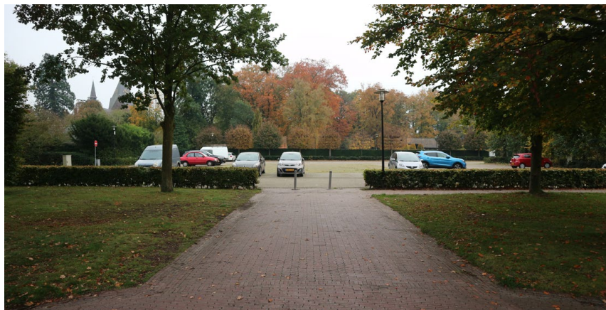
Figuur 6: Bestaand parkeerterrein aan de gemeentehuistuin

Het perceel ten westen van het parkeerterrein kan mogelijk onderdeel worden van dit gebied. Hierbij kan een deel worden ingezet voor parkeren en het deel tegen de erfgrans van de gronden aan de Spoorlaan met groen. Dit kan tevens dienen als verbinding met de gemeentehuistuin. De leibomen kunnen (als mogelijk) worden verplaatst richting de erfgrans. Als dit niet mogelijk is, kunnen deze bomen worden gekapt en vervangen worden door enkele vrijstaande grote bomen. Aan de zijde van het St. Maartenshuis is meer ruimte voor een toekomstige verbinding met de Pastorietuin.