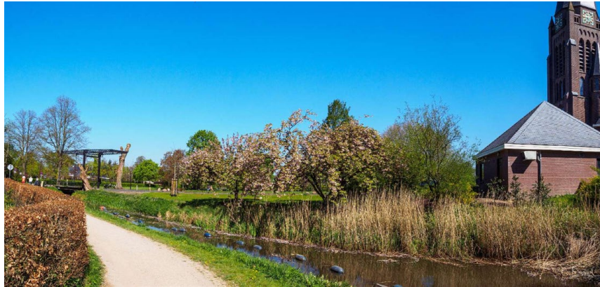
Figuur 9: Voorbeeld openbare tuin van de St. Plechelmuskerk in Saasveld

Bij het ontwerp van de inrichting van het evenemententerrein en de gemeentehuistuin wordt rekening gehouden met het mogelijk in de toekomst toevoegen van de pastorietauin als (semi)openbaar gebied.