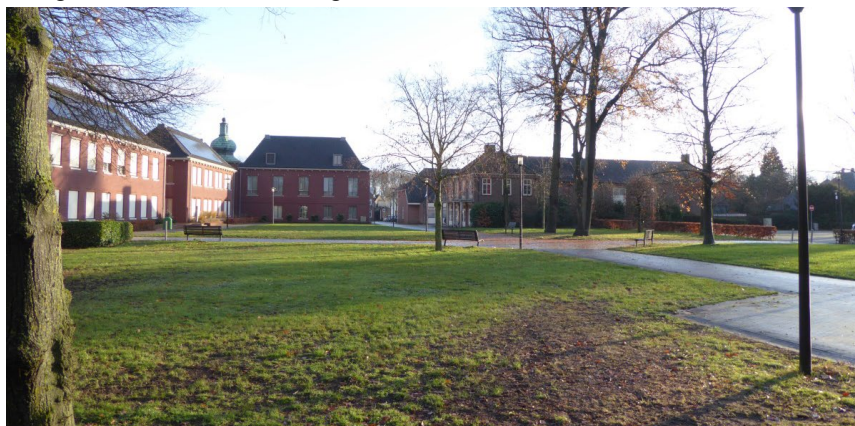
Figuur 5: De gemeentetuin