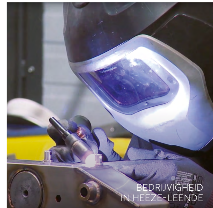
BEDRIJFVIGHEID IN HEEZE-LEENDE

Veel mensen komen van buitenaf naar onze gemeente vanwege de prachtige natuur in de directe omgeving. Maar ook op het gebied van cultuur is hier veel te zien en te bewonderen. Genoeg dus om de aandacht voor te vragen!