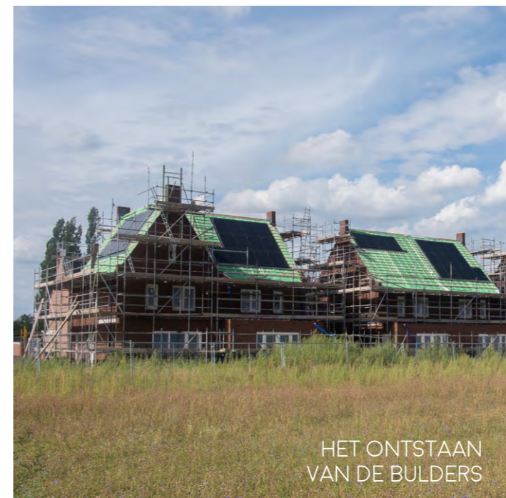
HET ONTSTAAN VAN DE BULDERS