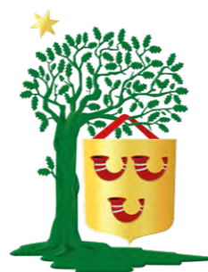
HET WAPEN VAN HEEZE-LEENDE