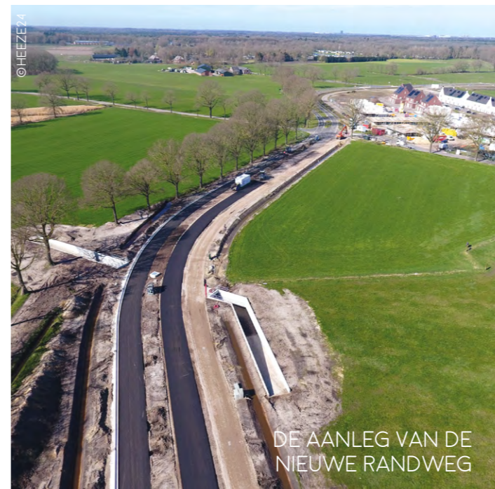
DE AANLEG VAN DE NIEUWE RANDWEG

In de bereikbaarheidsagenda worden verschillende vraagstukken besproken, zoals het verbeteren van de bereikbaarheid en leefbaarheid.