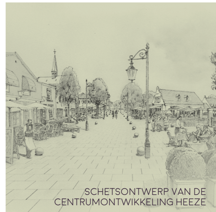
SCHETSONTWERP VAN DE CENTRUMONTWIKKELING HEEZE