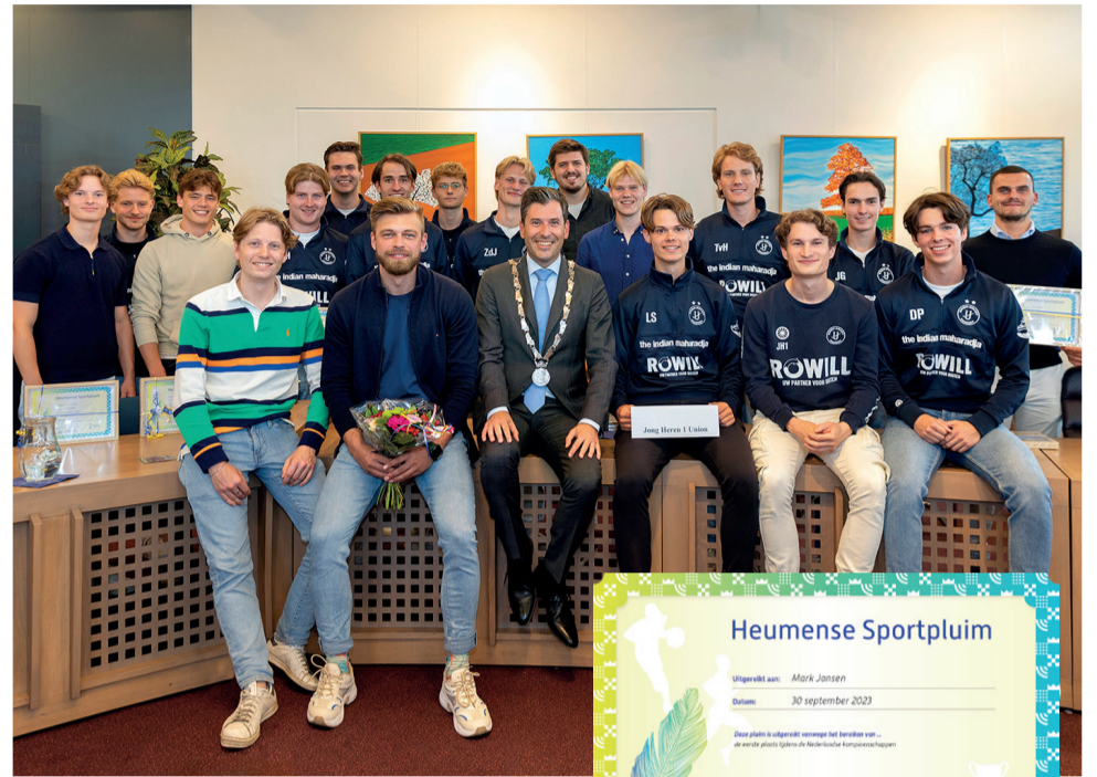
Union Hockey Team Heren onder de 25 jaar, gehuldigd op 29 mei 2024.