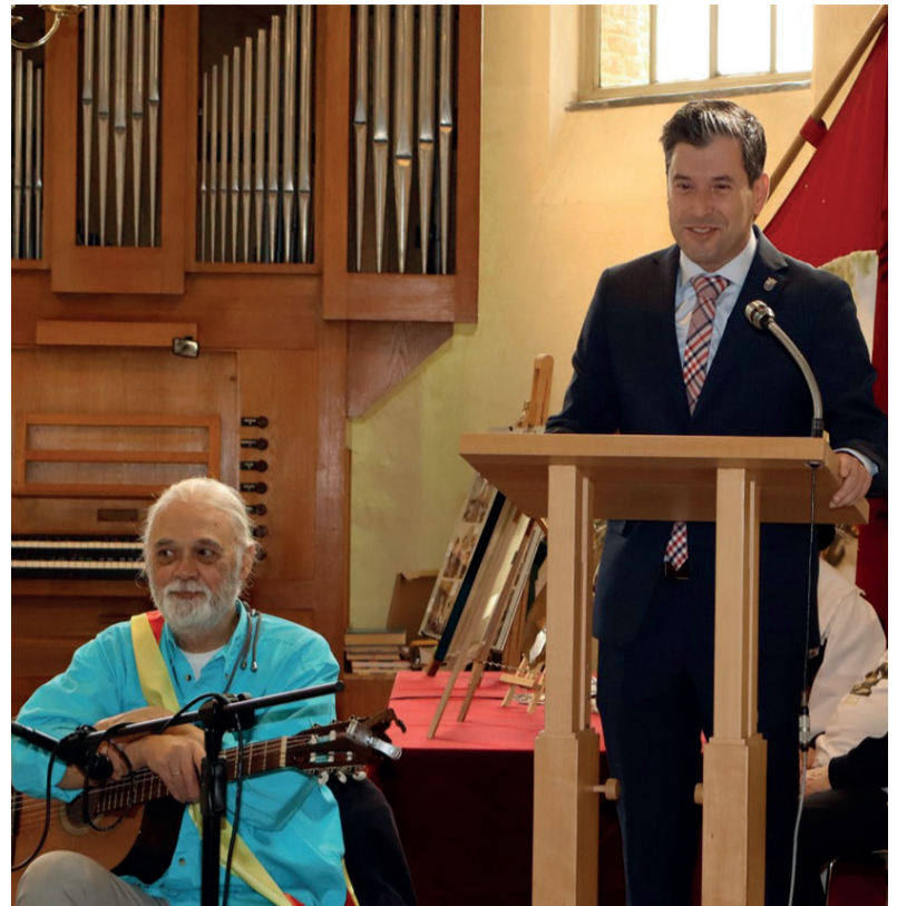
[Foto links] Het St. Georgiusgilde presenteert zich voor de Joriskerk. Het is een van de oudste Gilden van Nederland. Het werd in 1445 opgericht.