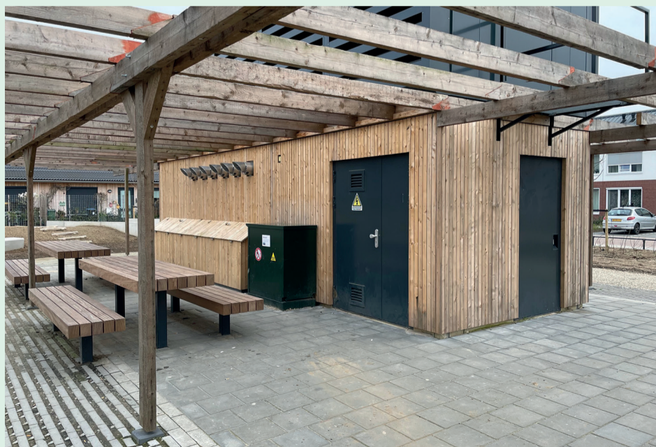
Ontmoetingspunt rond gezamenlijke warmtevoorziening in Didam.