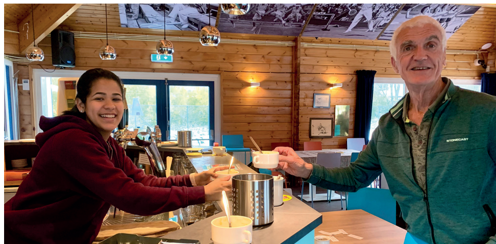
Foto gemaakt tijdens de wekelijkse buurtsoep

Algemene informatie: www.heumen.nl/vrijwilligerswerk