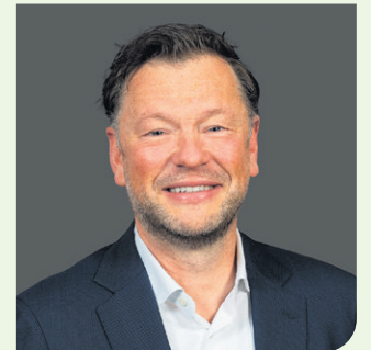
Wethouder Jacco Bartelds (VVD)