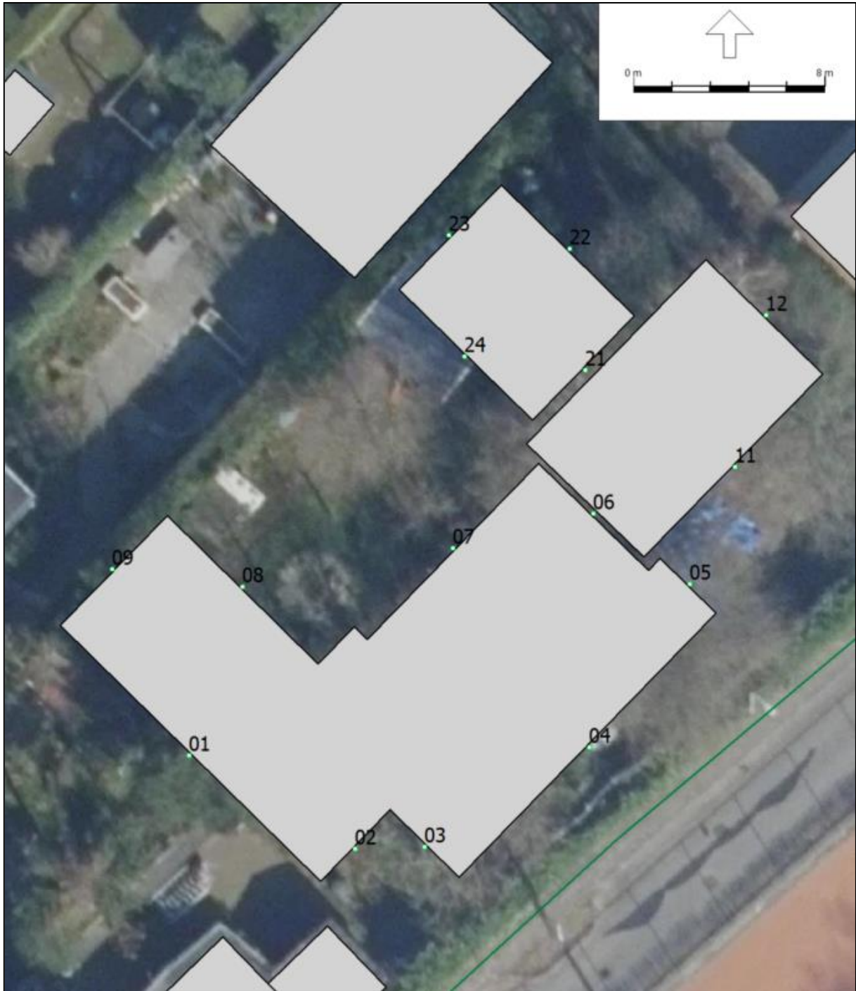
Figuur 2: Ontvangerpunten