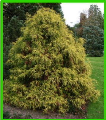
↓→ Westerse levensboom in vier verschillende vormen en maten.