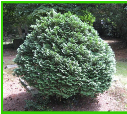
↑→ Californische cipres in drie verschillende vormen en maten.

Soorten van het geslacht Thuja en Chamaecyparis zijn groenblijvend en komen vaak voor in tuinen als heg of struik. Sommige soorten, kunnen snel uitgroeien tot een grote boom.