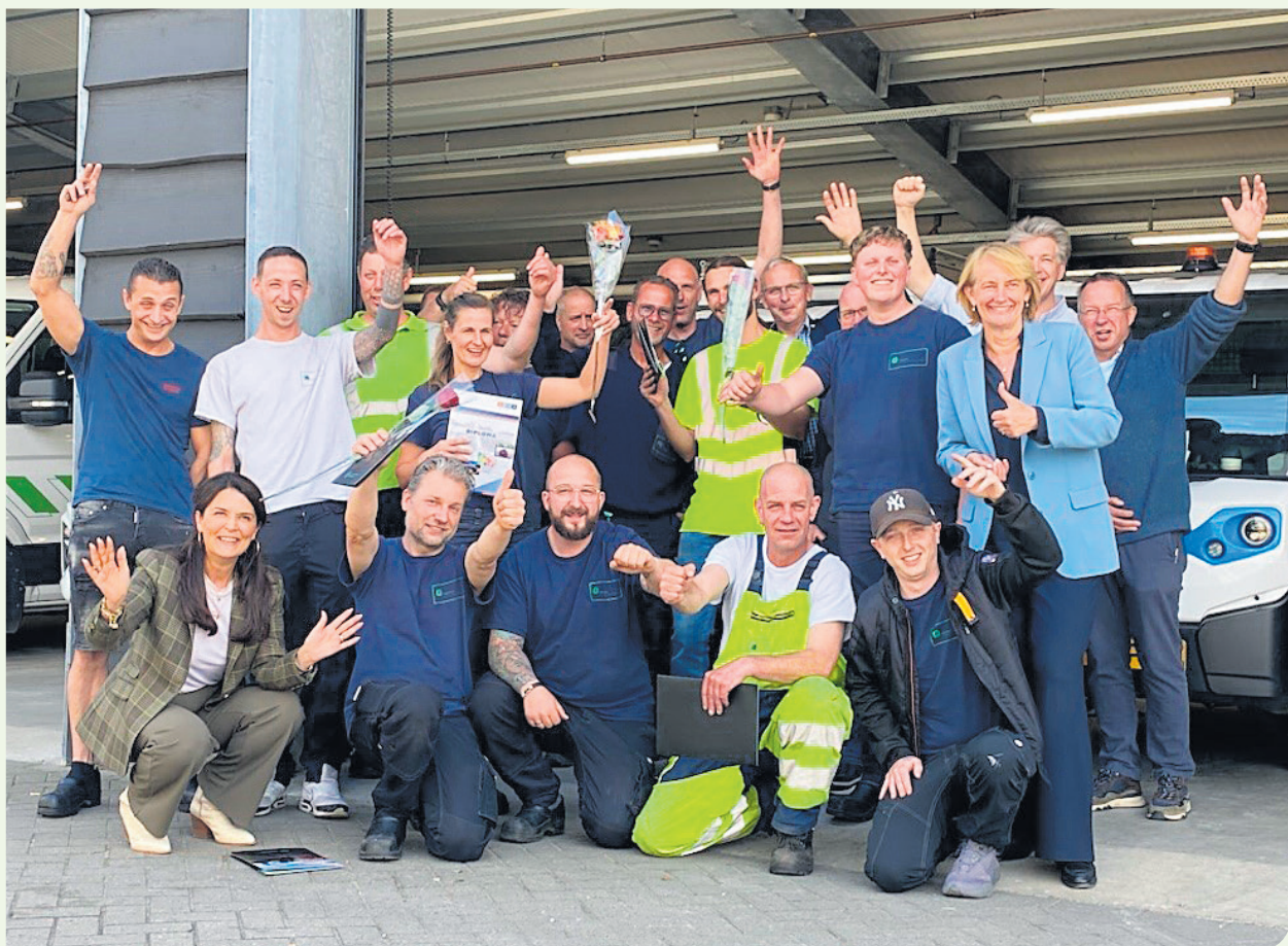
Achttien medewerkers hebben een MBO diploma op het vakgebied civiele techniek en aankomend hovenier behaald