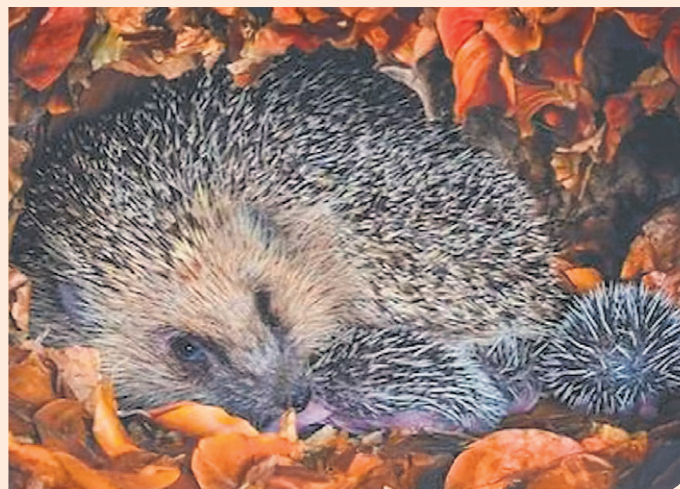
Egels zijn met uitsterven bedreigd en leven in hopen bladeren in de winter.