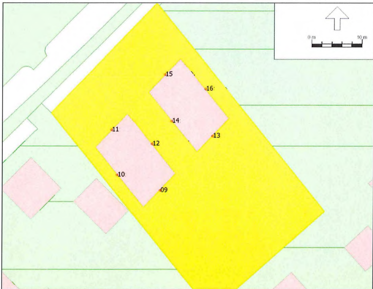
Figuur 3: Ontvangerpunten