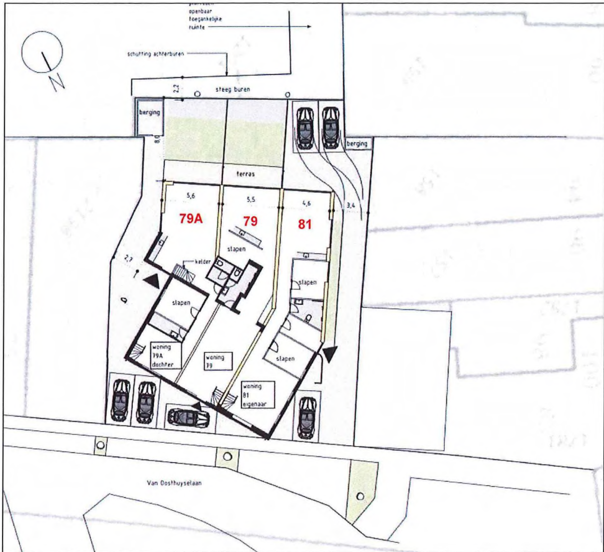
Figuur 1: Nieuwe situatie, begane grond (bron: aanvraag om omgevingsvergunning, blad 3-13F, d.d. 18-12-2023)