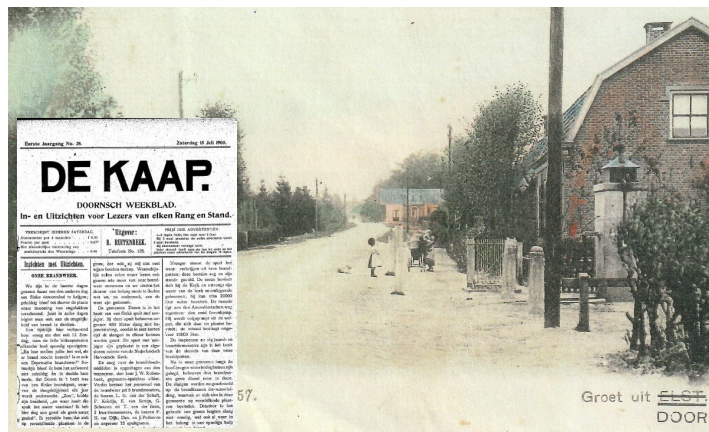
Een foto van de Amersfoortseweg uit 1910, met rechts de waterpomp. Inzet links: het artikel in weekblad De Kaap van 15 juli 1905.

Voor meer informatie: archeologie@heuvelrug.nl