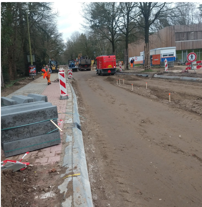
De Amersfoortseweg wordt grondig aangepakt.

Er is dan ook flink in de grond gegraven, met een interessante archeologische ontdekking tot gevolg.