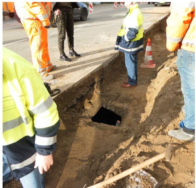
Onder het fietspad werd een merkwaardig gat in de grond gevonden.