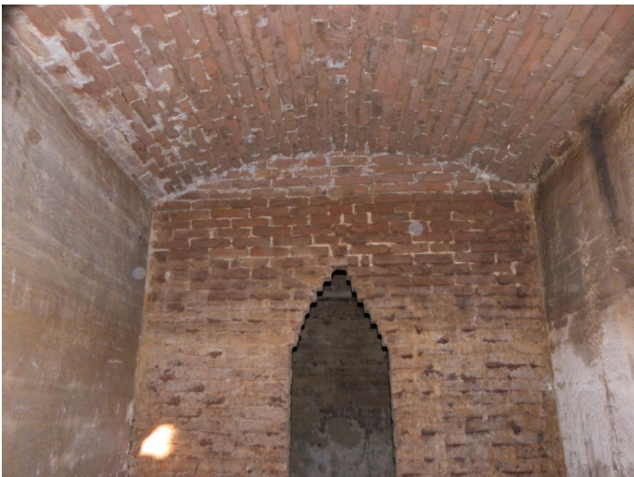
De binnenkant van de waterkelder, met één van de tussenmuurtjes en het gewelfd dak.

Uit archiefonderzoek door leden van de oudheidkamer in Doorn bleek dat deze kelder naast de oude waterpomp lag, die al sinds 1869 aan de Amersfoortseweg in gebruik was. Deze dorpspomp haalde zijn water echter rechtstreeks uit de grond, dus de kelder fungeerde niet als drinkwaterbassin. Maar waar diende deze dan wél voor?