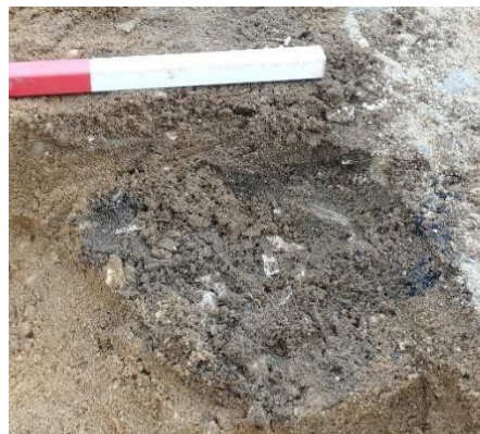
Stukjes verbrand bot (witte brokjes in de donkere ondergrond) van een gecremeerde overledene.

De archeologen vonden allerlei donkere vlekken in de ondergrond. Dit zijn overblijfselen van weggerotte palen, dichtgegooide (afval)kuilen of oude greppels. Maar men stuitte op nóg iets bijzonders: gecremeerde menselijke resten!