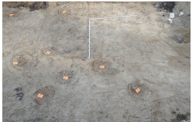
Verkleuringen in de grond onder het gesloopte bedrijf; sporen van oude gebouwen?

Al snel na de sloop van het bedrijf werd duidelijk dat de bebouwing de ondergrond weliswaar voor een deel verstoord had, maar dat een groot deel van het archeologische niveau nog prima intact was.