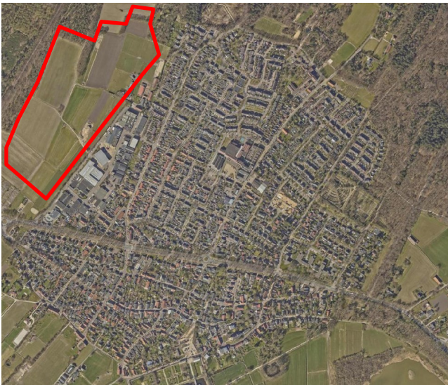
Luchtfoto van Amerongen met aan de westkant het gebied waar vermoedelijk al in de ijzertijd (of eerder) gewoond werd.

Al lange tijd vermoeden archeologen dat onder de weilanden direct ten noordwesten van Amerongen een archeologische vindplaats verscholen ligt. Hier zouden bewoningssporen liggen die in elk geval teruggaan tot de ijzertijd (circa 500 v.Chr), maar misschien zelfs nog verder. Direct grenzend aan dit weiland bevinden zich de bedrijven aan de Industrieweg Noord en de Bertus Leendersweg. Toen in 2021 duidelijk werd dat één van deze bedrijven zou worden gesloopt en vervangen door nieuwbouw, werd de kans geboden om te onderzoeken of de oude bewoningssporen ook tot onder deze bebouwing reiken.