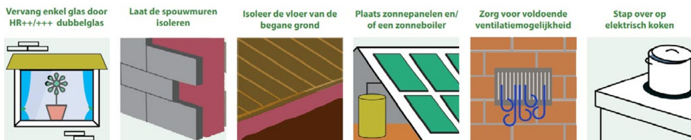
Mogelijkheden om uw woning voor te bereiden op de overstap naar aardgasvrij

makkelijker de overstap naar aardgasvrij. Voor de woningen in onze gemeente staat de stap van isolatie de komende jaren centraal. Verduurzaming van woningen resulteert in minder energiekosten, en zorgt voor een positief effect op de maandelijkse rekening.