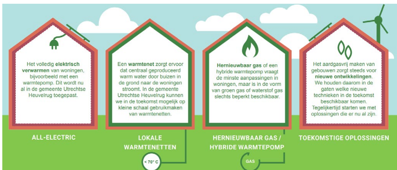
Alternatieven voor aardgas

De verduurzaming van energiebronnen zorgt ervoor dat er geen aardgas of andere fossiele energie meer nodig is om onze huizen en gebouwen te verwarmen. Dat betekent dat de elektriciteit duurzaam wordt opgewekt, dat we duurzame warmte gaan gebruiken voor warmtenetten en dat al het gas dat we in 2050 nog gebruiken duurzaam gas is.