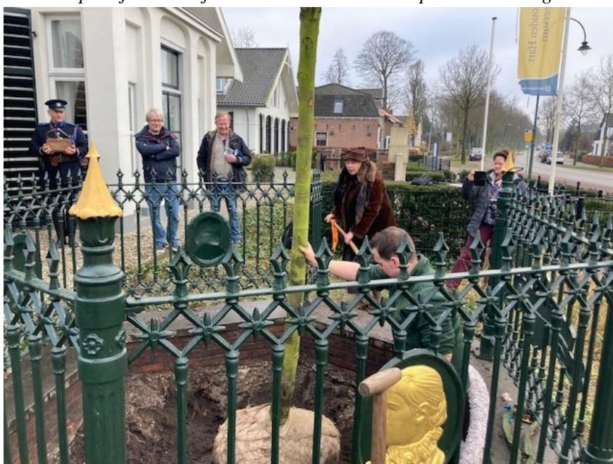
Het aanplanten van de nieuwe koningsboom door “Koningin Wilhelmina” op 20 januari bij het Gouden Hart aan de provinciale weg

Gedeputeerde Staten Utrecht heeft in januari 2022 vanuit bestuurlijke betrokkenheid met het zwaar getroffen deel van het provinciale grondgebied, aan Provinciale Staten voorgesteld om € 1,5 miljoen beschikbaar te stellen. De provincie Utrecht omschrijft het in de Statenbrief als een uitzonderlijke situatie, met lokaal zeer grote maatschappelijke impact en excessieve schade. De provinciale bijdrage is te onderscheiden in twee hoofdcomponenten. Naast een subsidie van € 0,5 miljoen voor de gemeente zelf (als getroffen partij) en een meer specifieke bijdrage voor herstel van de schade in het buitengebied bij terreinen met een beschermde status vanuit natuur- of monumentenwetgeving (€ 1,0 miljoen). Met dat laatste sluit de provincie aan bij hun beleidsverantwoordelijkheid voor natuur, recreatie en erfgoed in het landelijke gebied. Nadat Provinciale staten een definitief besluit heeft genomen (voorzien 1 e kwartaal 2022), kan de gemeente een subsidieaanvraag indienen. De provincie kent in een beschikking de subsidie toe met daaraan gekoppeld