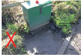
Niet goed bereikbaar